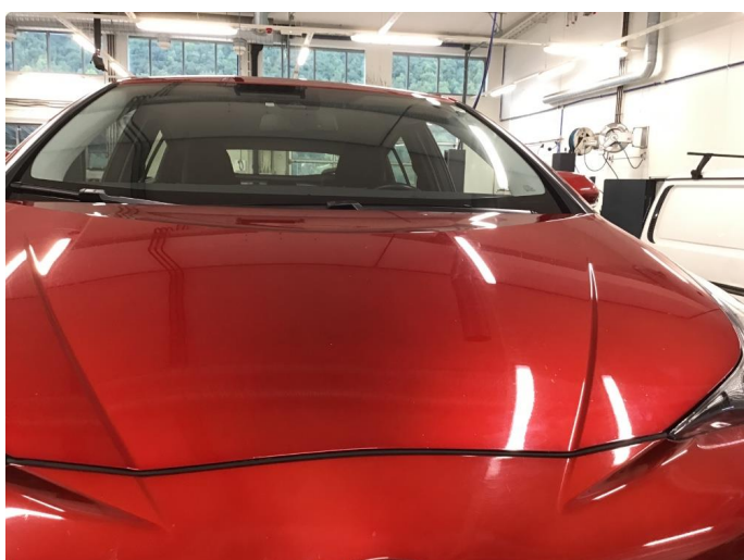
1.3 Mye stensprut