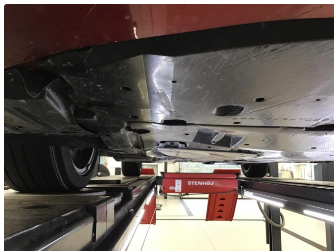
1.2 Beskyttelsesplate skadet/mangler