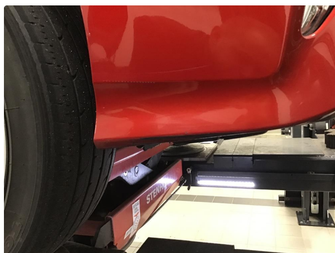
1.4 Skrubbskader underkant