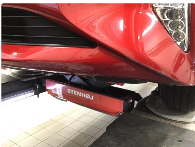
1.4 Skrubbskader underkant