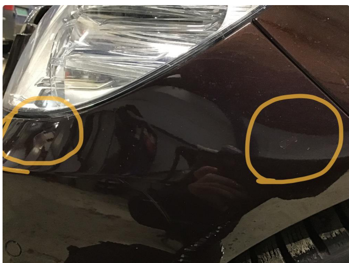
1.5 Lakk flasser