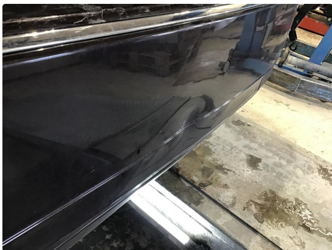
1.7 Flere bulker