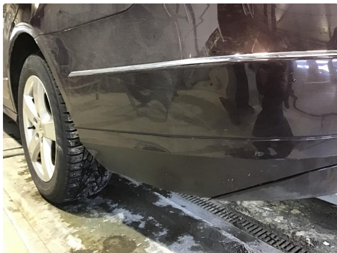
1.7 Flere bulker