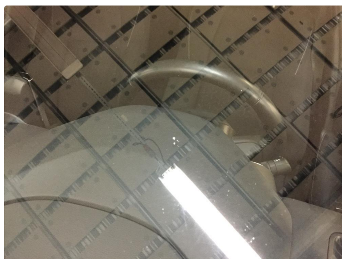
1.3 Steinsprut i synsfelt