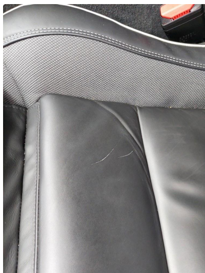
3.1 Skade på setepute