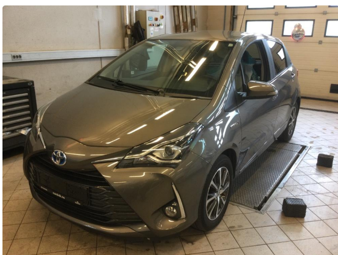
1.1 Øvrige feil