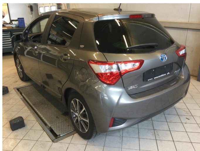
1.1 Øvrige feil