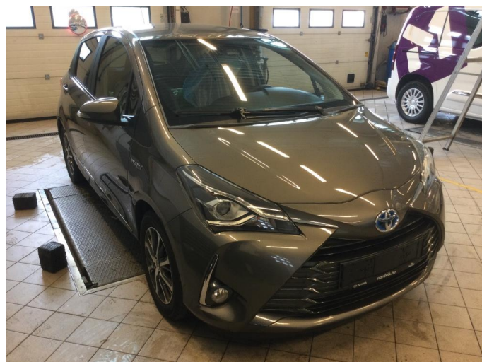
1.1 Øvrige feil