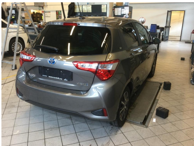
1.1 Øvrige feil