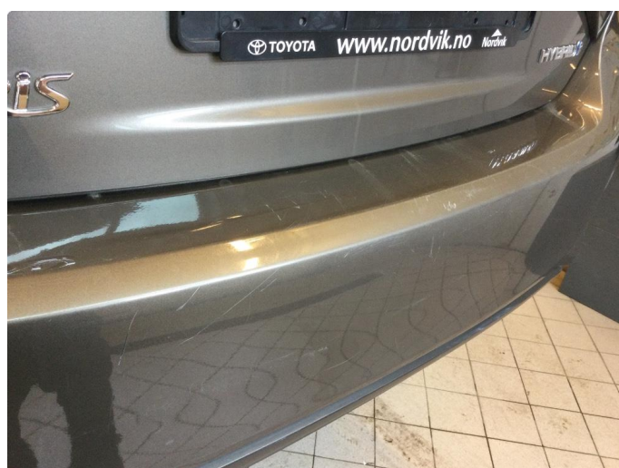
1.4 Ripe(r) ned til grunning