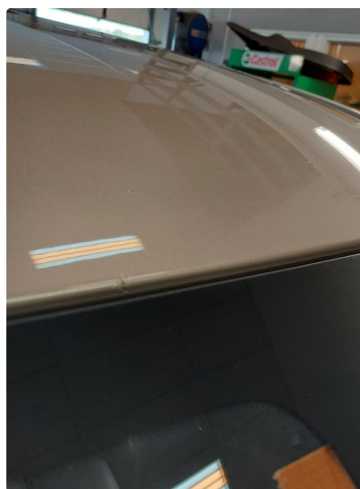
1.7 Lakk flasser