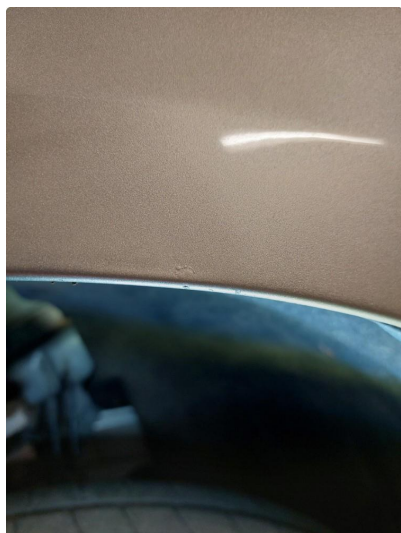
1.3 Lakk flasser