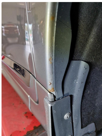
1.3 Lakk flasser