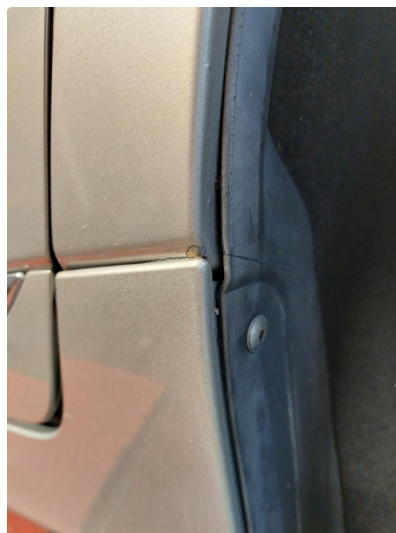
1.3 Lakk flasser