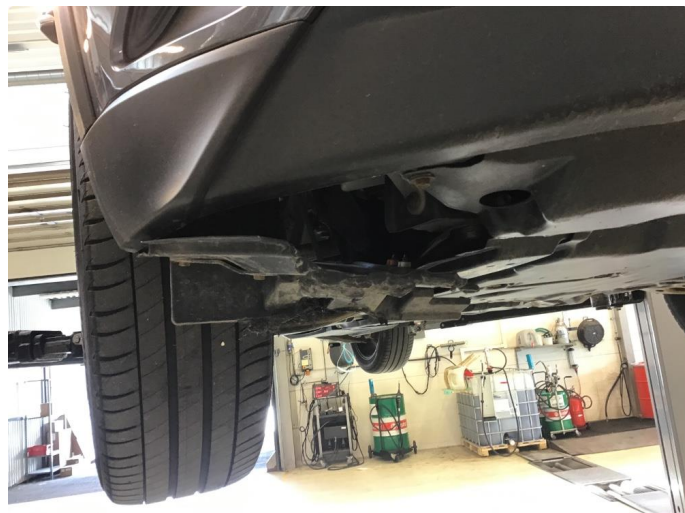
1.1 Plastinnerskjerm skadet