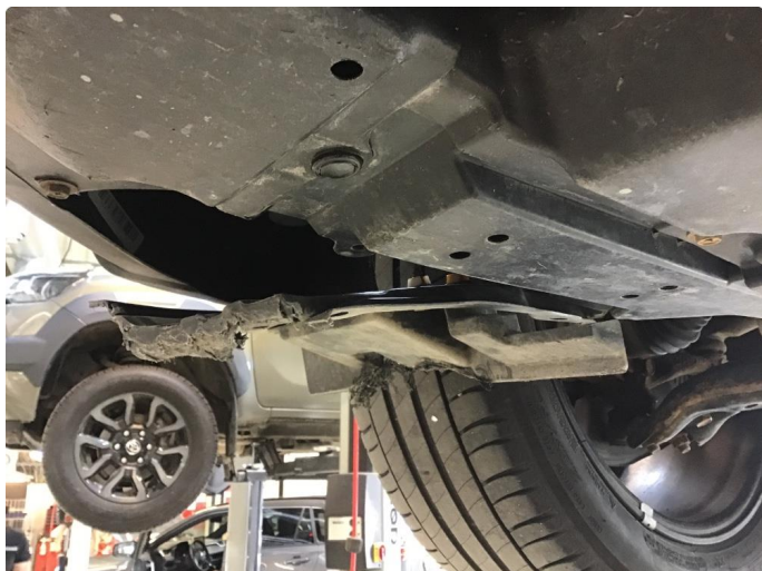
1.1 Plastinnerskjerm skadet