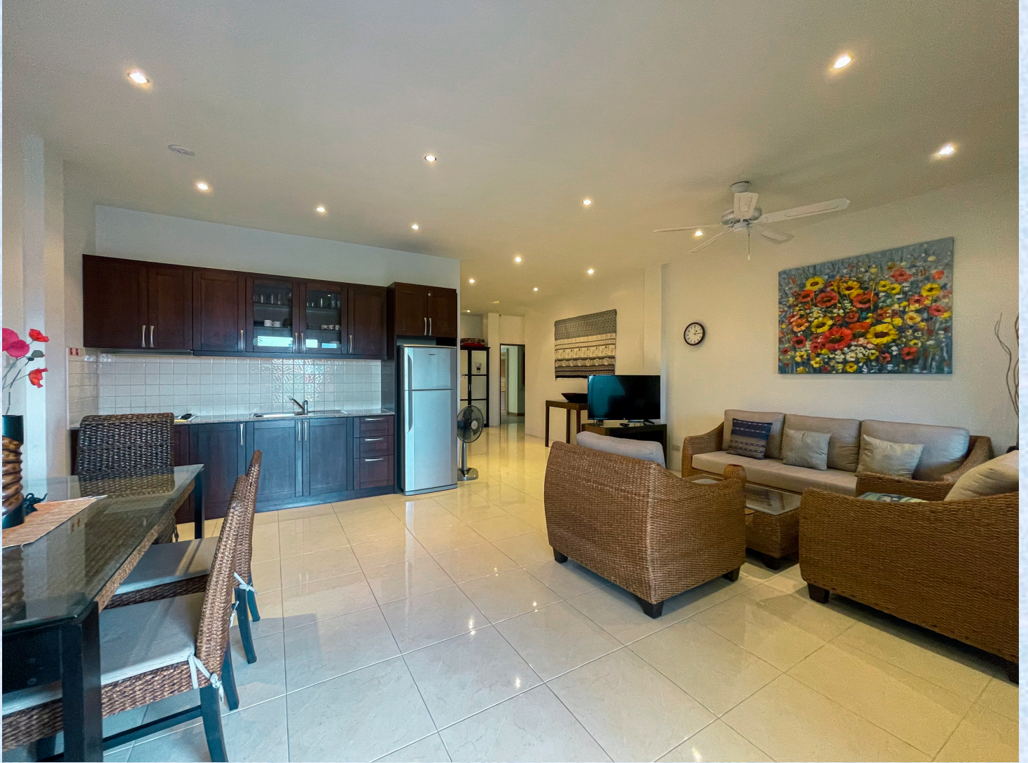
En fullt ut møblert og utrustet leilighet klar til innflytning.