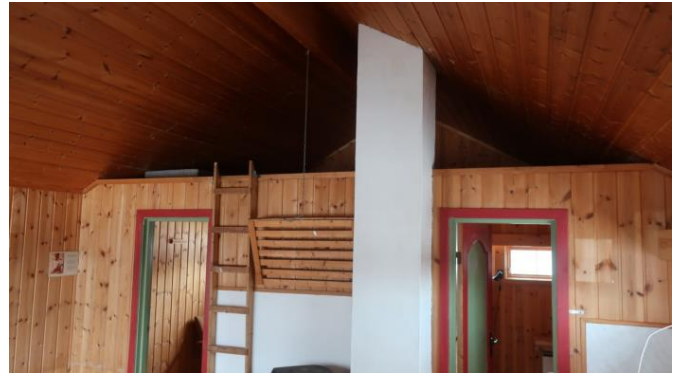
Stige til hems.