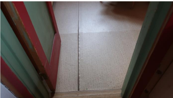
Skade på gulvbelegg i soverom.