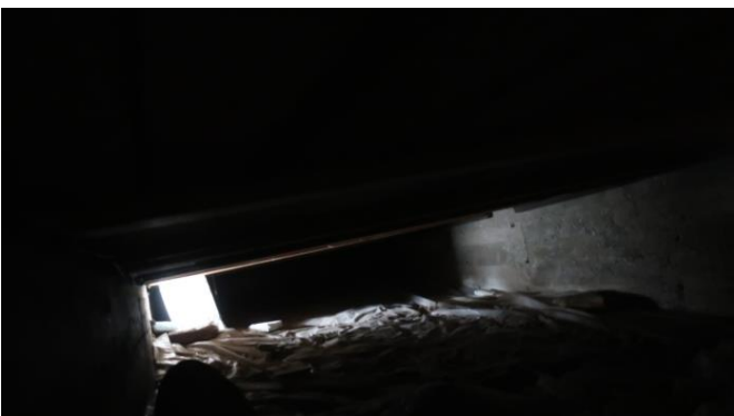
Bilde tatt gjennom ventil i muren

Krypkjeller er besiktiget gjennom ventiler i muren. Det ligger plast på bakken under hytta og det er tørt.