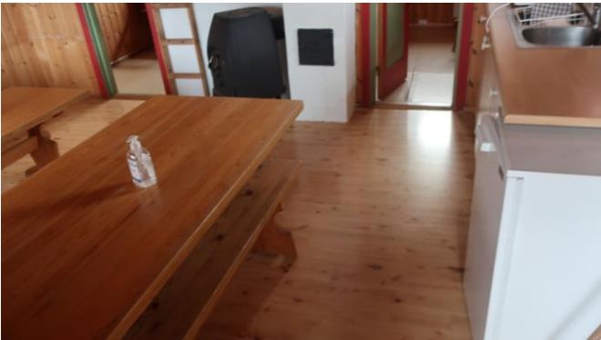
Laminatgulv i stue/kjøkken.

Plategulv med belegg i soverom og nyere belegg (2015) i stue/kjøkken. En ser godt plateskjøtene under belegget i soverom. Slitt og skadet belegg. Furupanel på vegger og himling i hytta. Mønet himling i stue/kjøkken og på hems, flat himling i soverom.