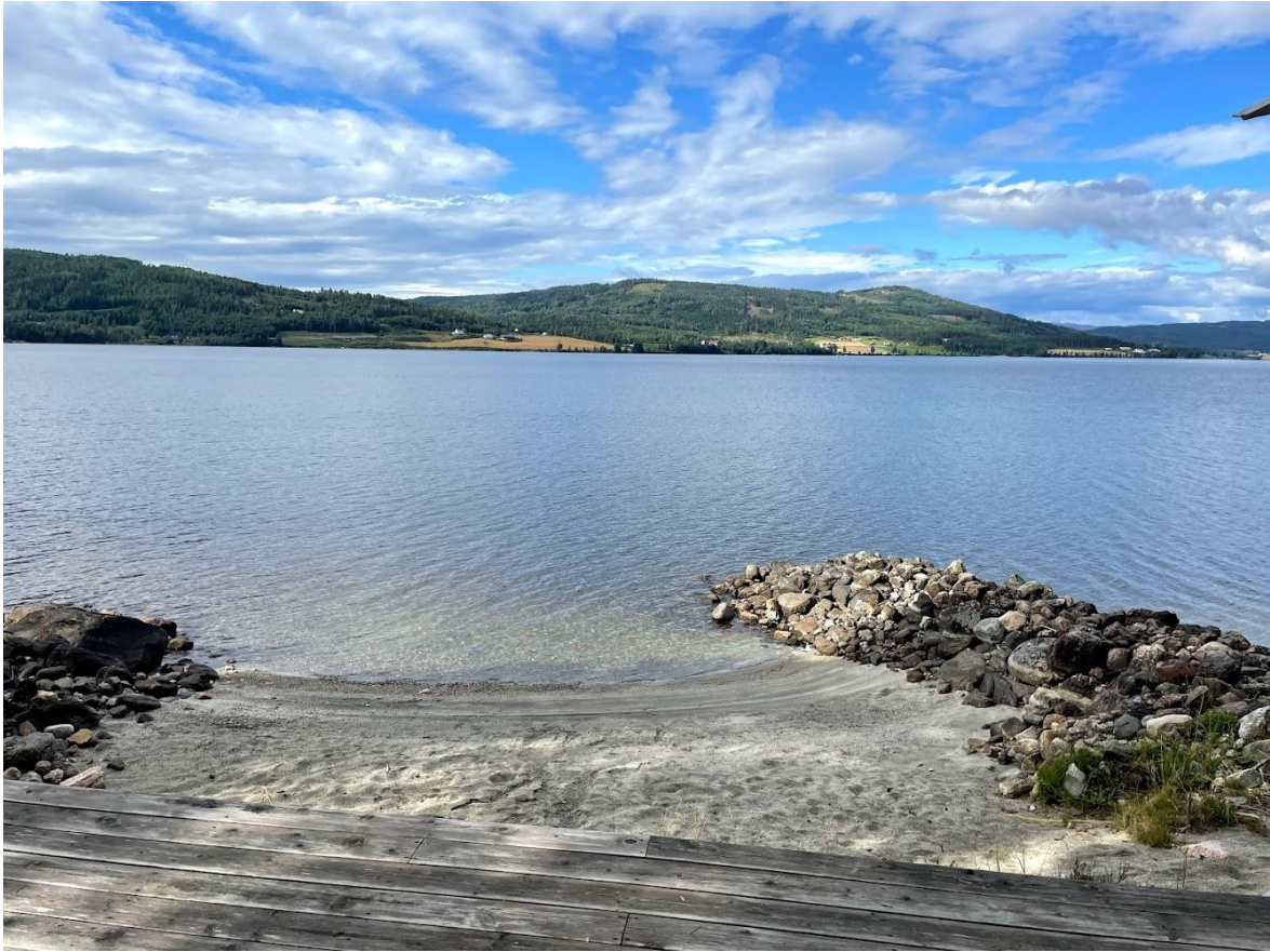
Felles badeplass med sandstrand og plattung med utemøbler