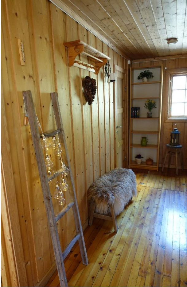
Åpen gang fra stue mot soverom.