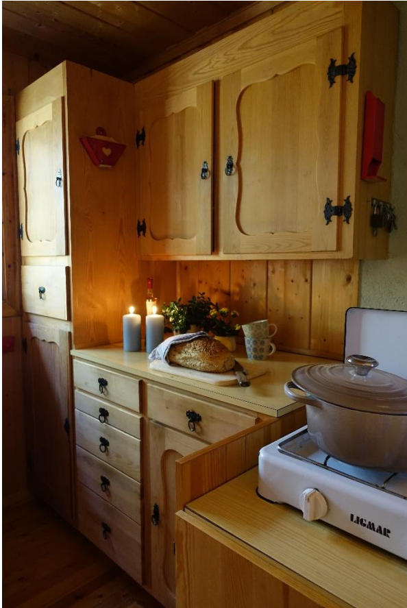
Detaljer fra kjøkkenet