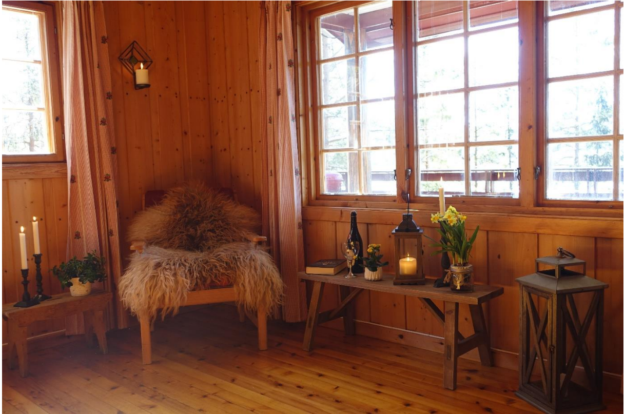
Hyggelig krok i stua med utsikt over Krøderen.