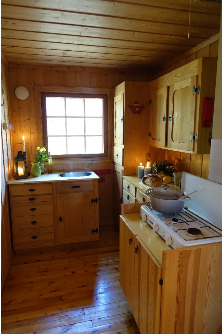
Kjøkkenkrok i åpen løsning.