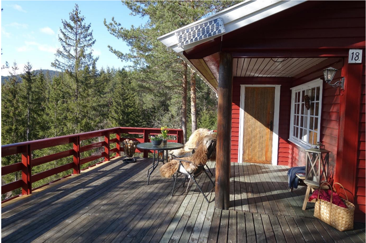
Romslig veranda med svært gode solforhold og flott utsikt.