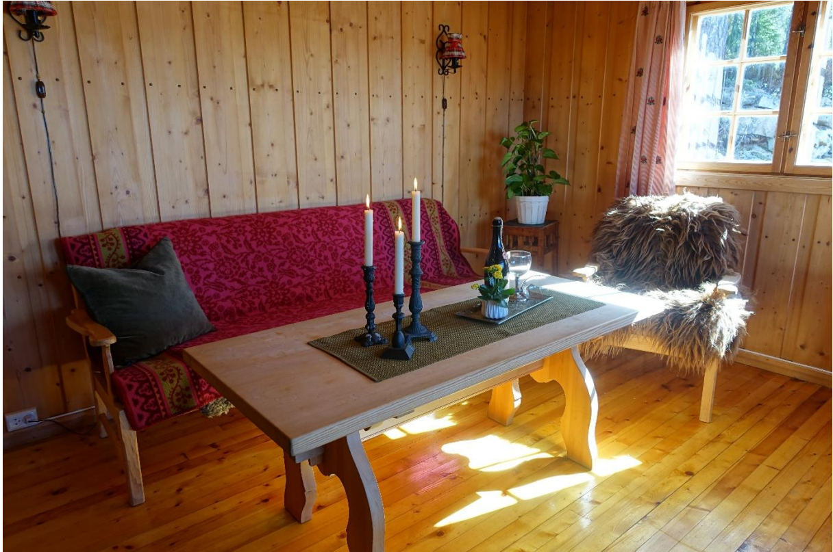
Romslig stue med gode lysforhold.