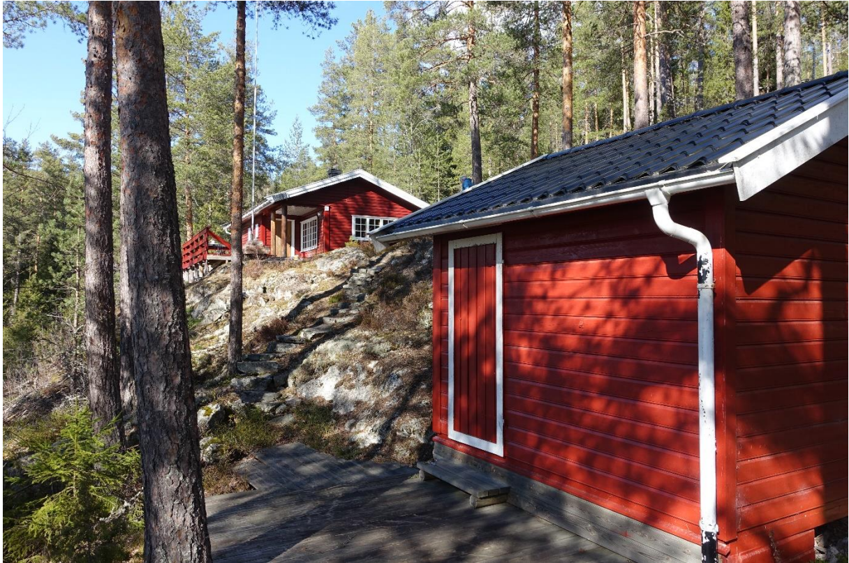
Satt opp nytt uthus i 1997 med lager og utedo. Trapp ned fra hytta.