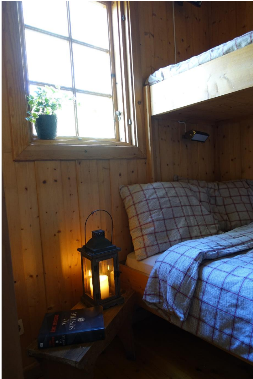
Et av to soverom. Begge har plassbygde senger, et med vanlig køyeseng og et med familiekøye (bildet over).