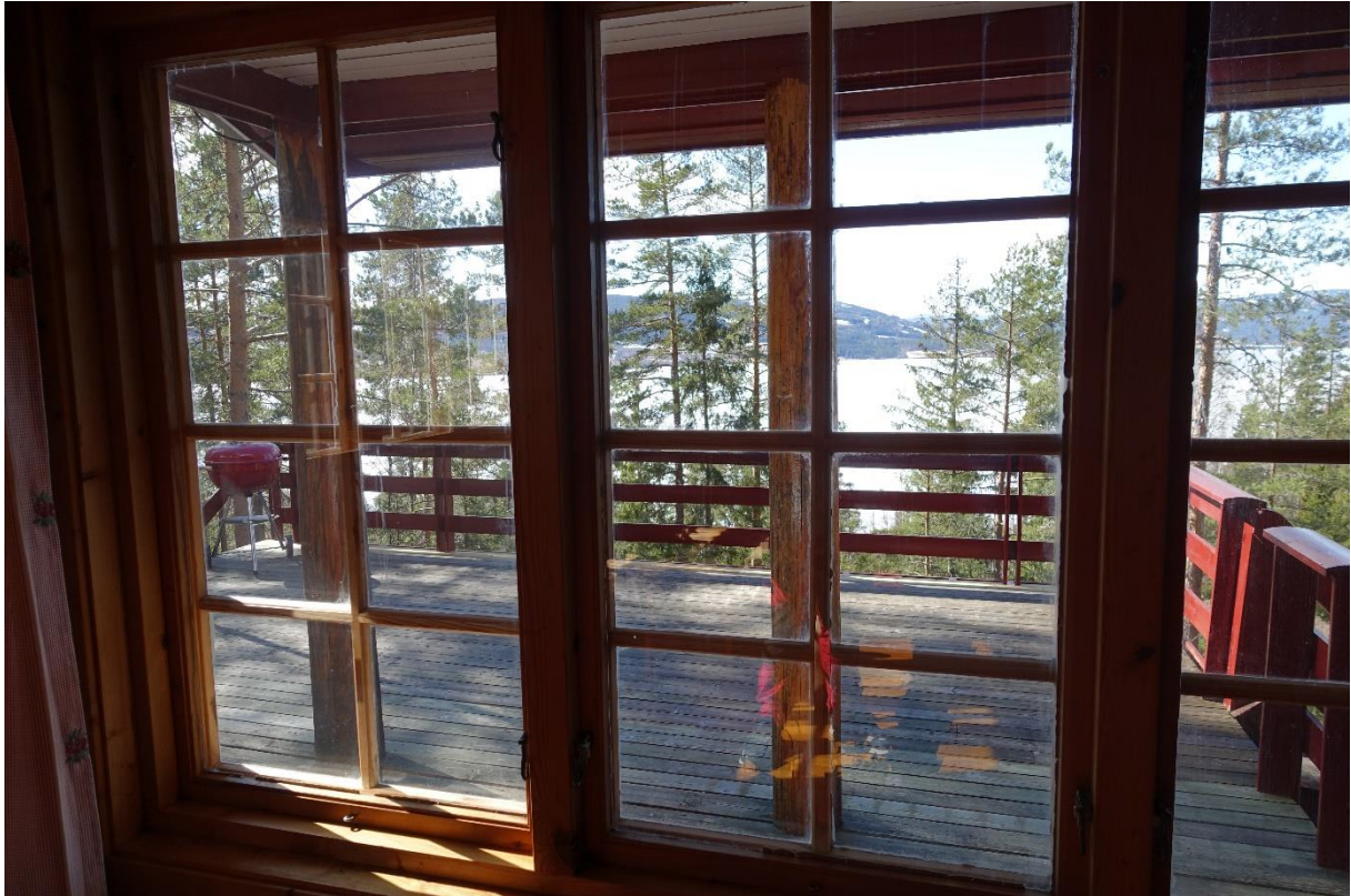
Utsikt fra stua – flere av disse trærne er nå fjernet.