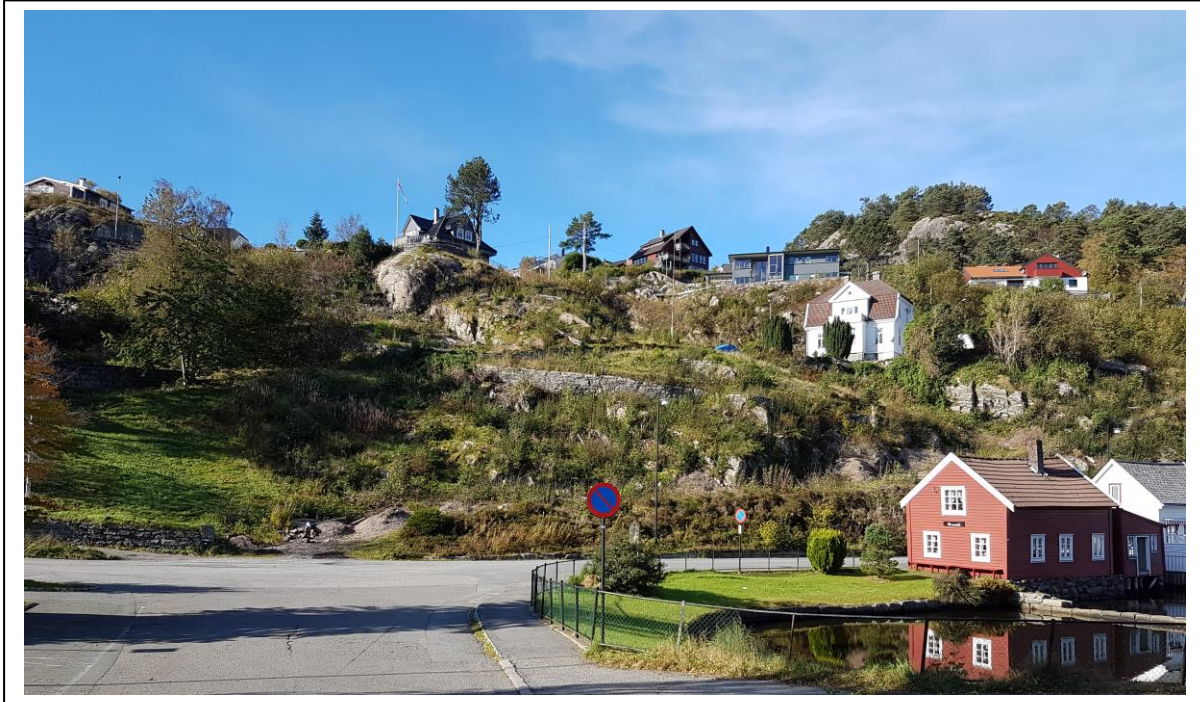
Oversiktsbilde tomteområde - sett fra Kirken / Viksundtomten.

Havna as skal omsette en del tomter i Strusshamn. Tomtene ligger med flott utsikt over Strusshamn og over leden inn til Bergen. Tomtene er godkjent regulert og utskilt, med fremført og opparbeidet vei vann og kloakk – byggeklare tomter.