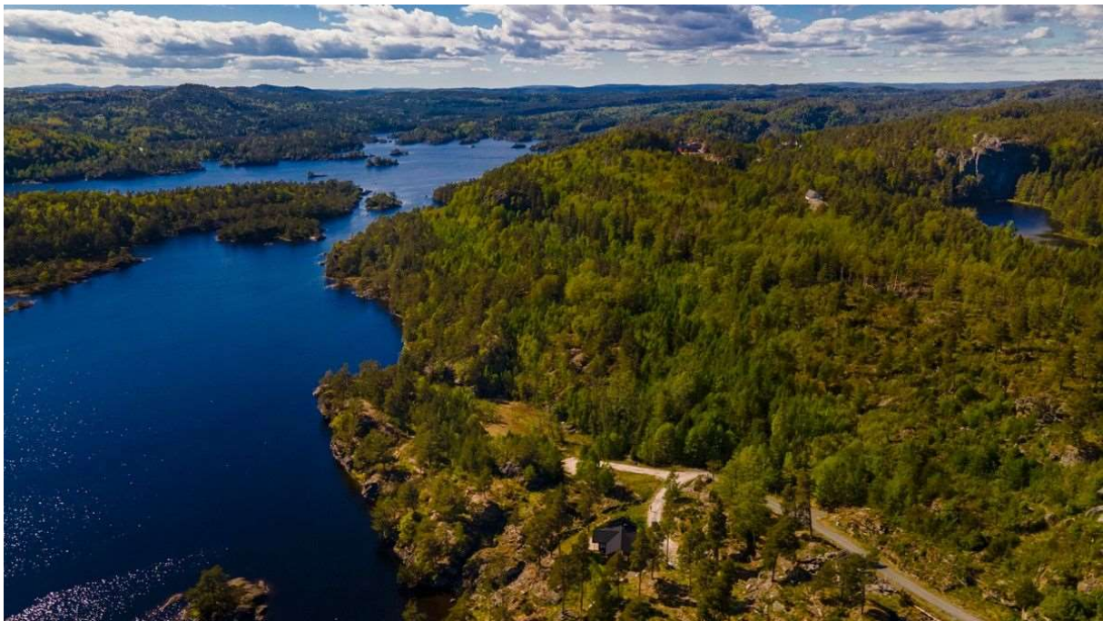
Deler av Skarvann.