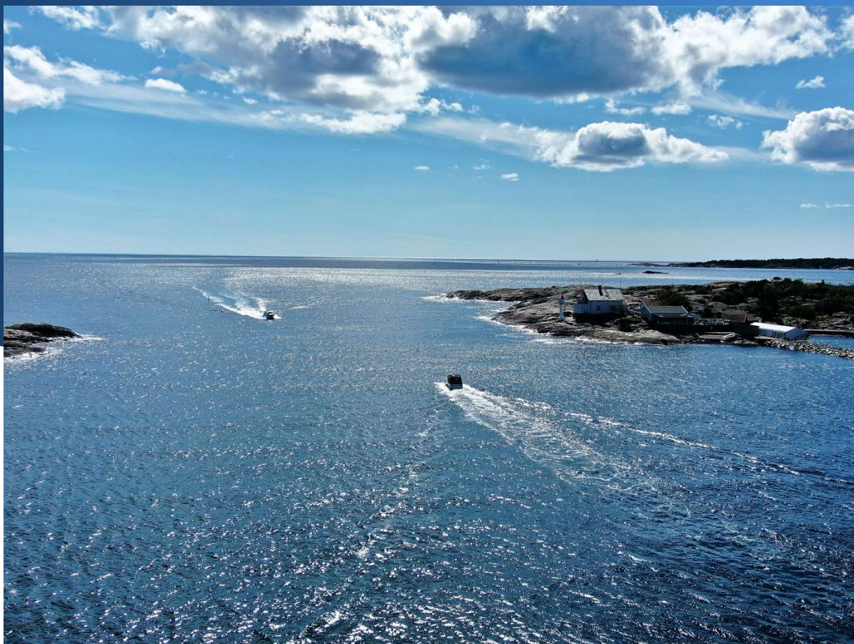
Kort vei til skjærgården i Risør, her Stangholmen Fyr til høyre.