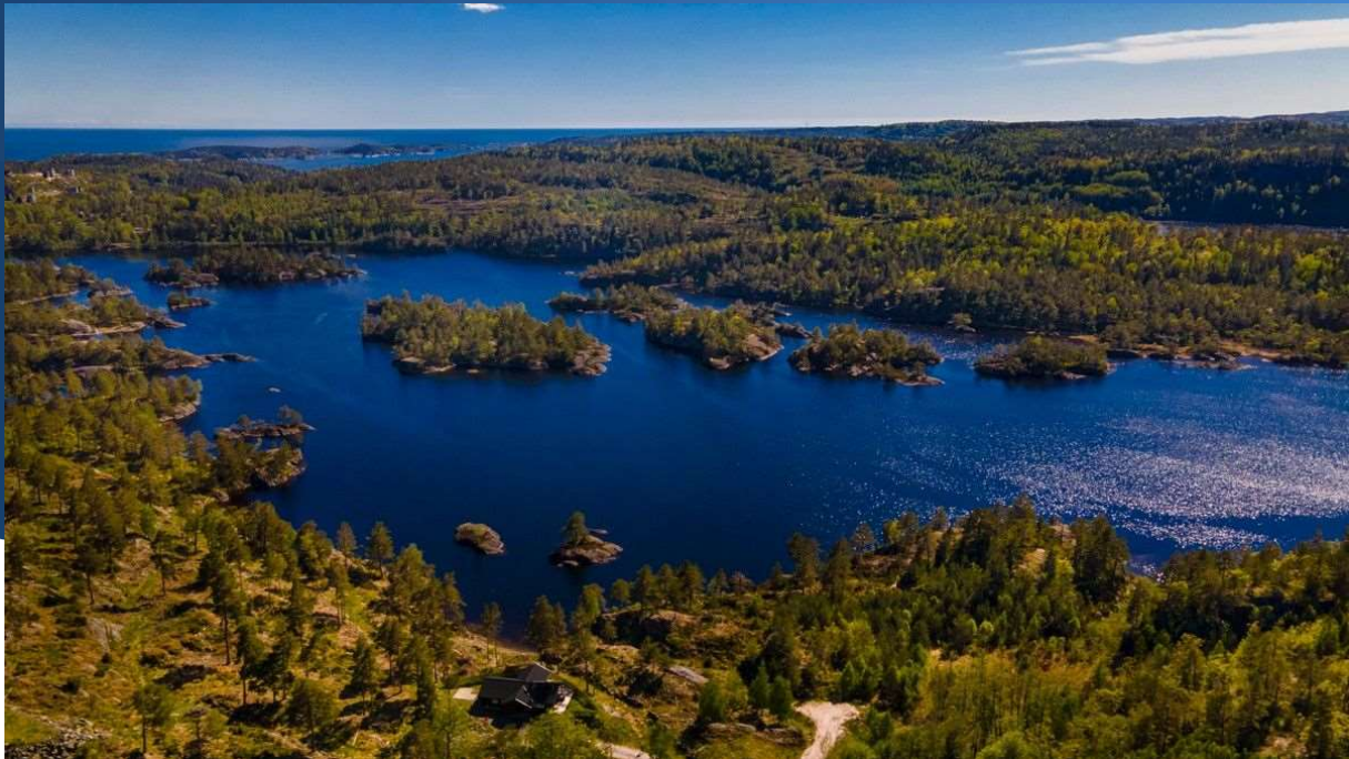
Flotte Skarvann, dronebilde fra området. Kort vei til havet og båtplasser.