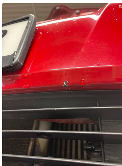
1.1 Noen små bulker med lakkskader