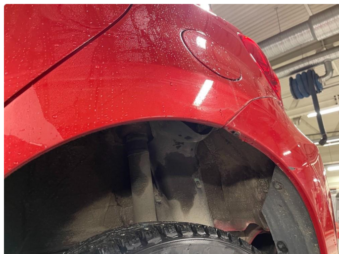
1.1 Noen små bulker med lakkskader