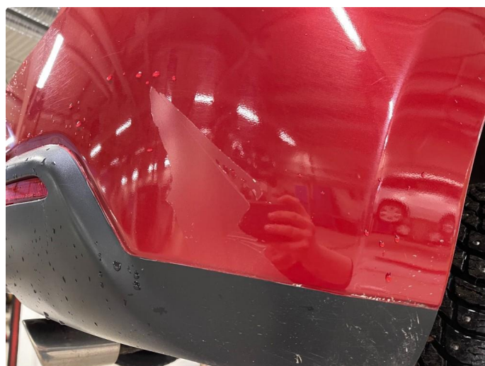
1.1 Noen små bulker med lakkskader