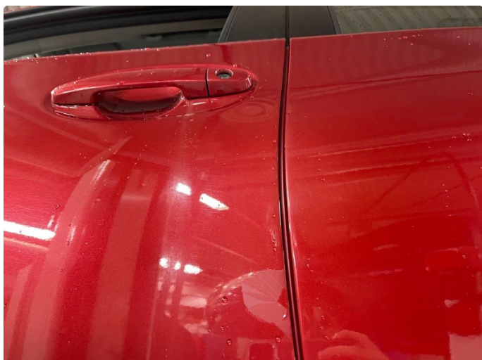
1.1 Noen små bulker med lakkskader