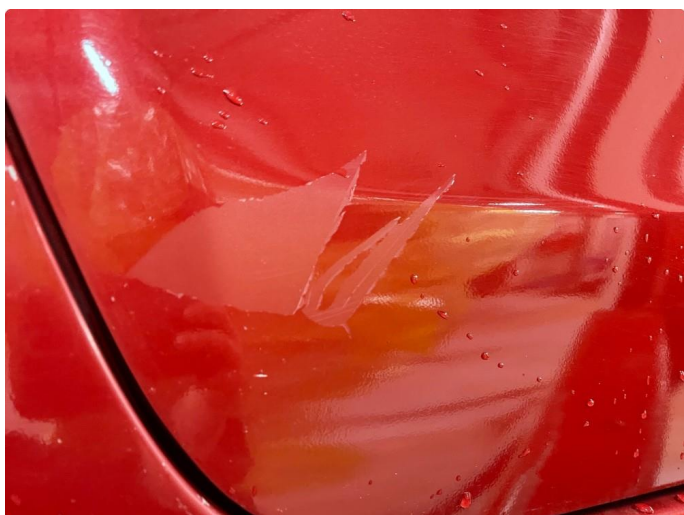
1.1 Noen små bulker med lakkskader