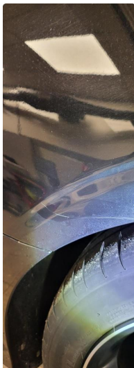
1.1 Ripe(r) ned til grunning