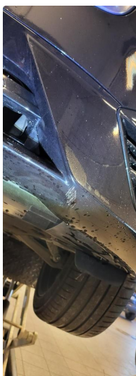
1.3 Skrubbskader underkant