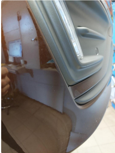
1.2 Lakk flasser