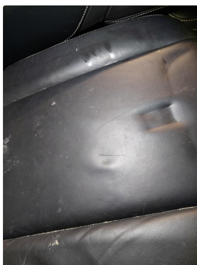
2.1 Skade på setepute