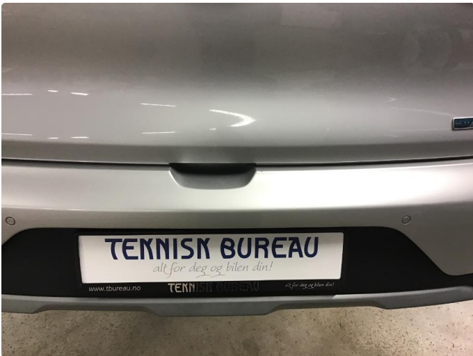
1.3 Noe slitasje i innlasting til bagasjerom