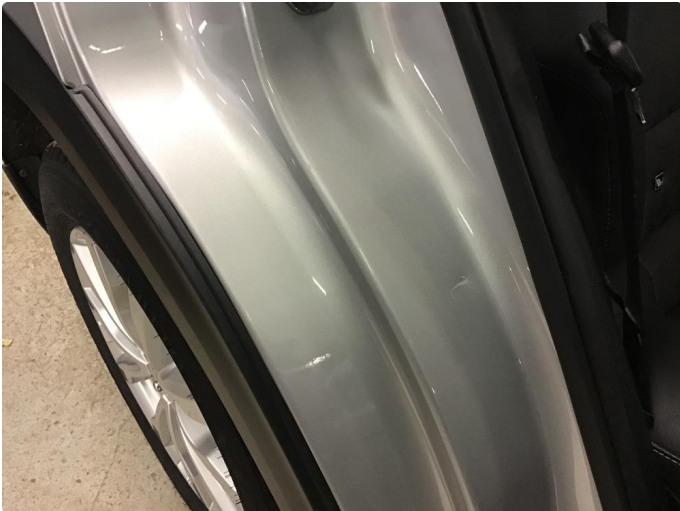
1.2 Merke etter beltespenn