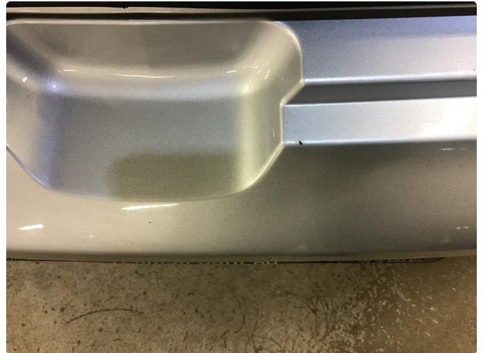
1.3 Noe slitasje i innlasting til bagasjerom