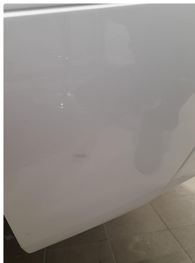
1.2 Mindre ripe(r)