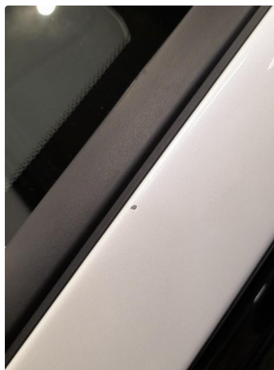
1.4 Mindre steinsprang