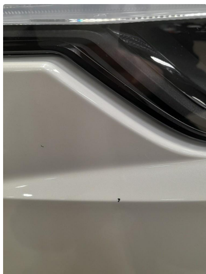
1.3 Mindre steinsprang