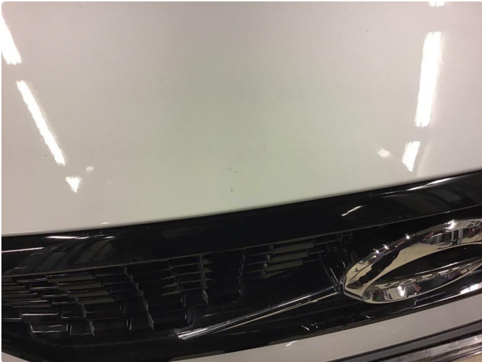
1.1 Pittesmå steinsprang