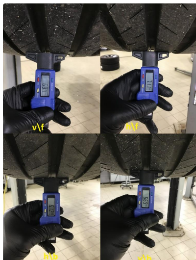
1.1 Hjulsett to takseres ved innlevering