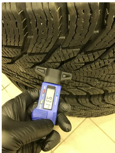
1.1 Hjulsett to takseres ved innlevering