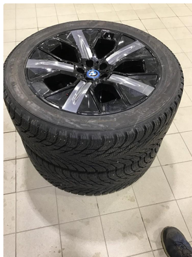
1.1 Hjulsett to takseres ved innlevering