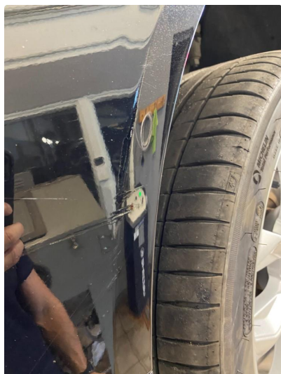
1.3 Ripe(r) ned til grunning