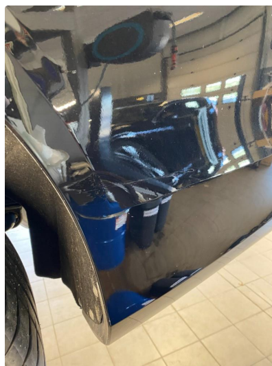
1.3 Ripe(r) ned til grunning