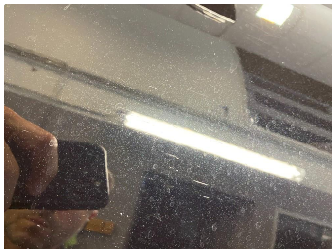
1.3 Ripe(r) ned til grunning