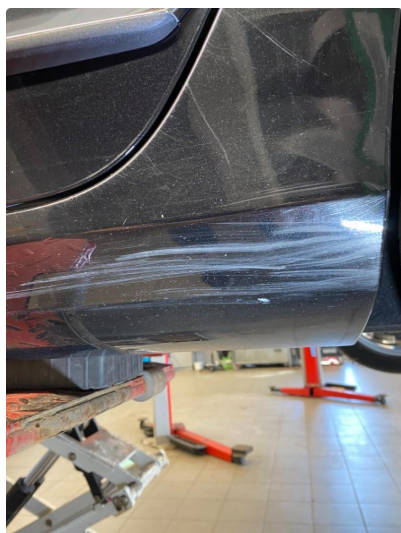
1.3 Ripe(r) ned til grunning