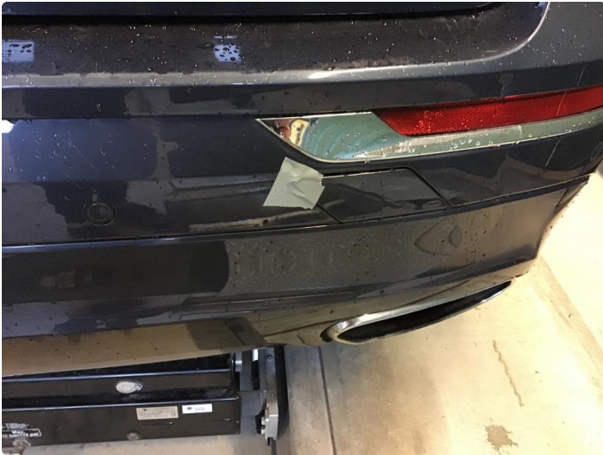
1.2 Liten skade høyre bak