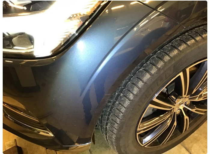
1.1 Noen riper på venstre side