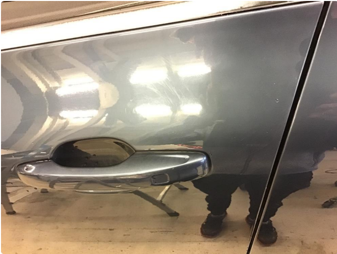
1.1 Noen riper på venstre side