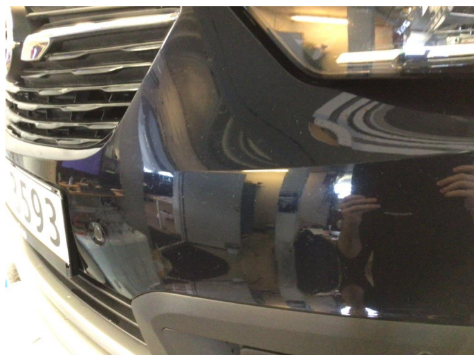
1.2 Noe steinsprut