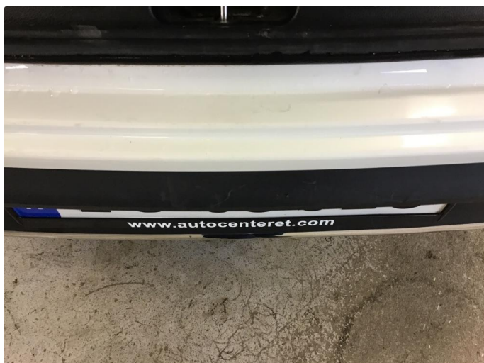
1.2 Normal slitasje i innlastning til varerom