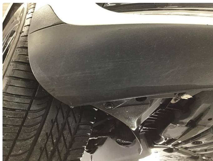
1.4 Mindre skrubbing i underkant av fanger