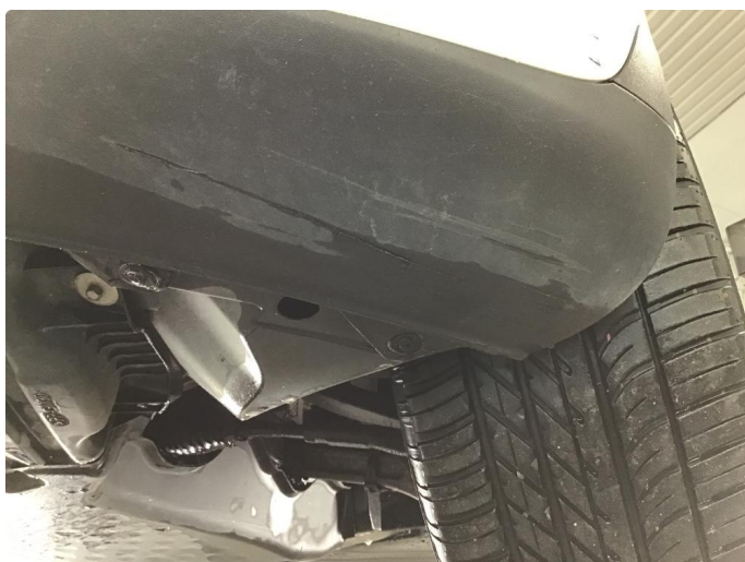
1.4 Mindre skrubbing i underkant av fanger