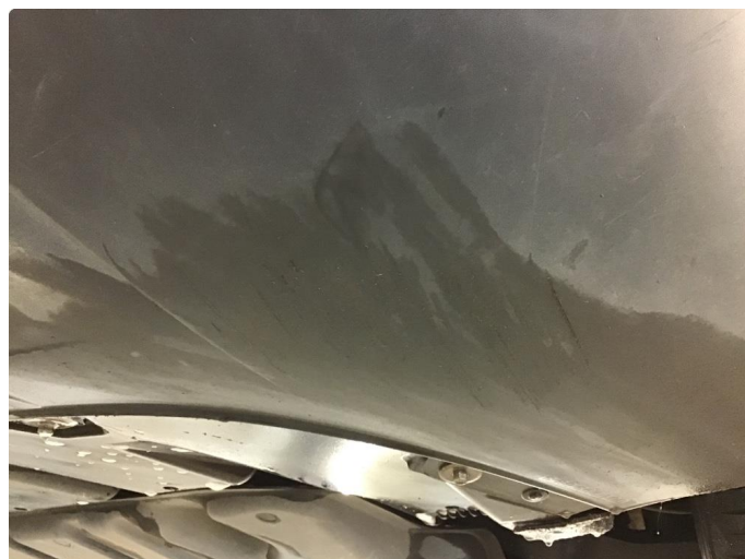
1.3 Mindre skrubbing i underkant av fanger