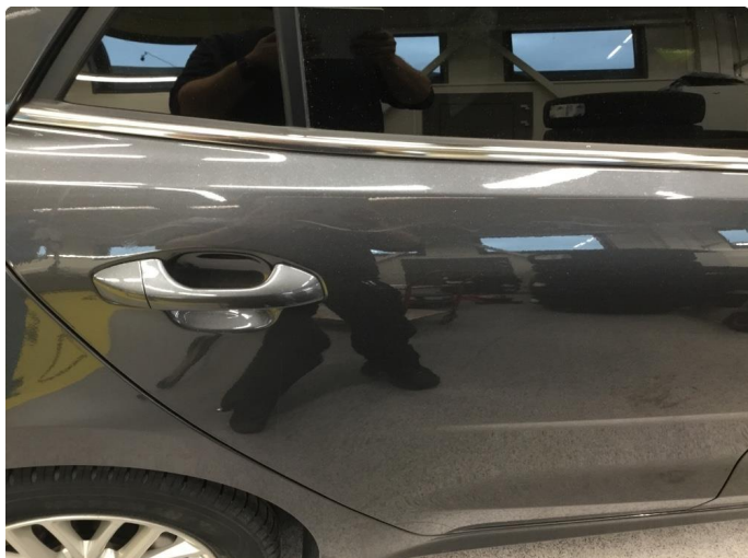
1.1 Ufagmessig utført arbeid