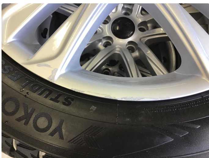
1.4 Kantkjørt felg