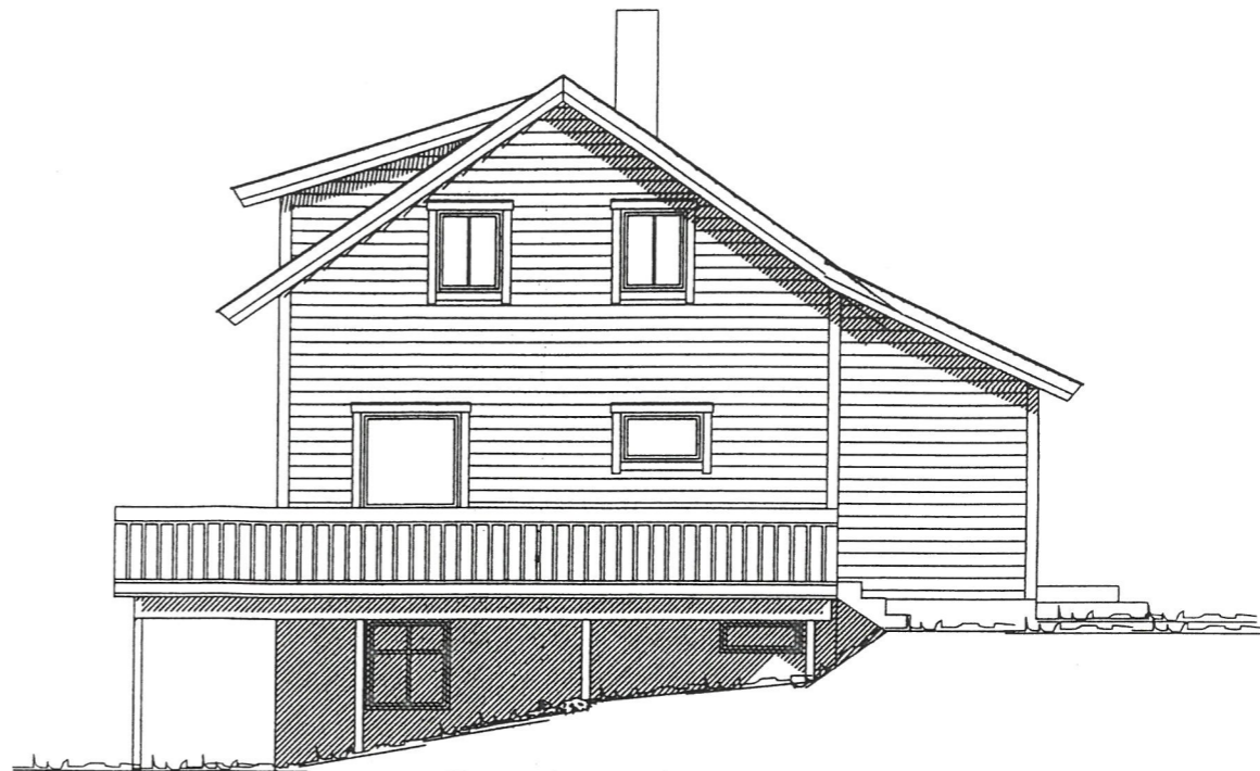
Fasade mot sør