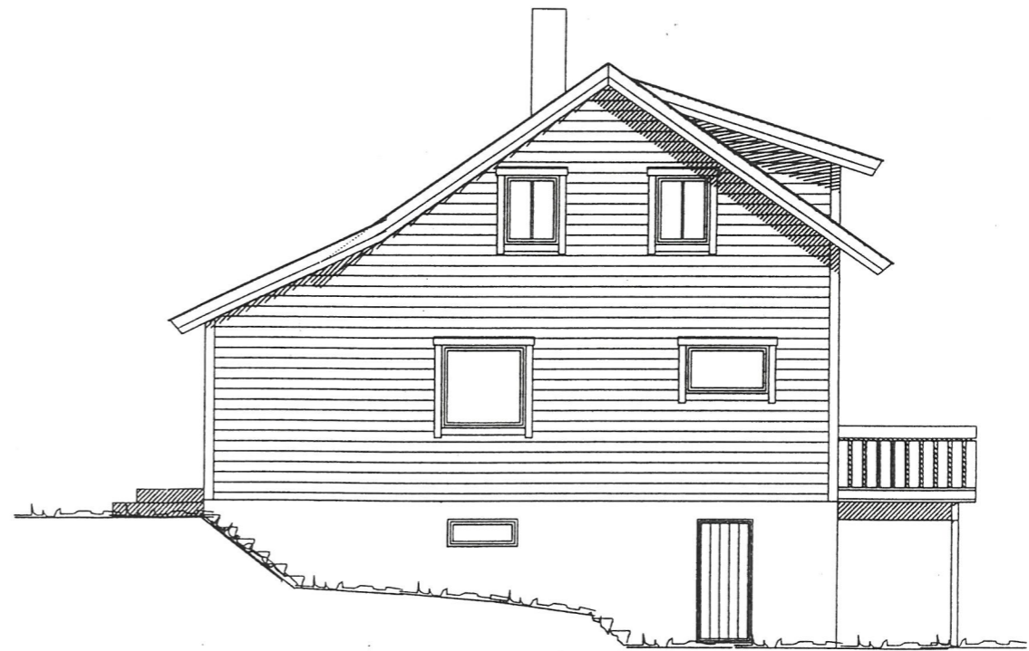
Fasade mot nord

TEIAD KOMMUNE 17.10.2001 D-166/01 Sign. [Signature]