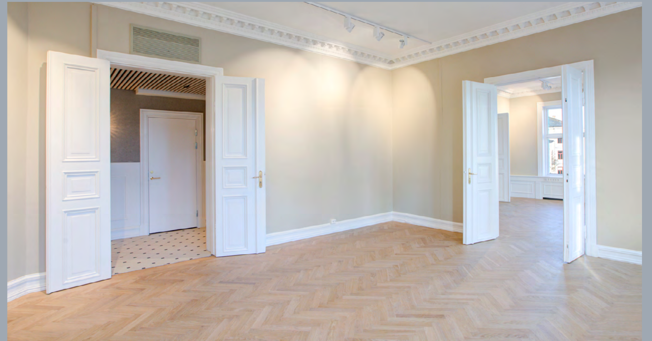
Klassisk fiskebensparkett i arbeids- og møterom