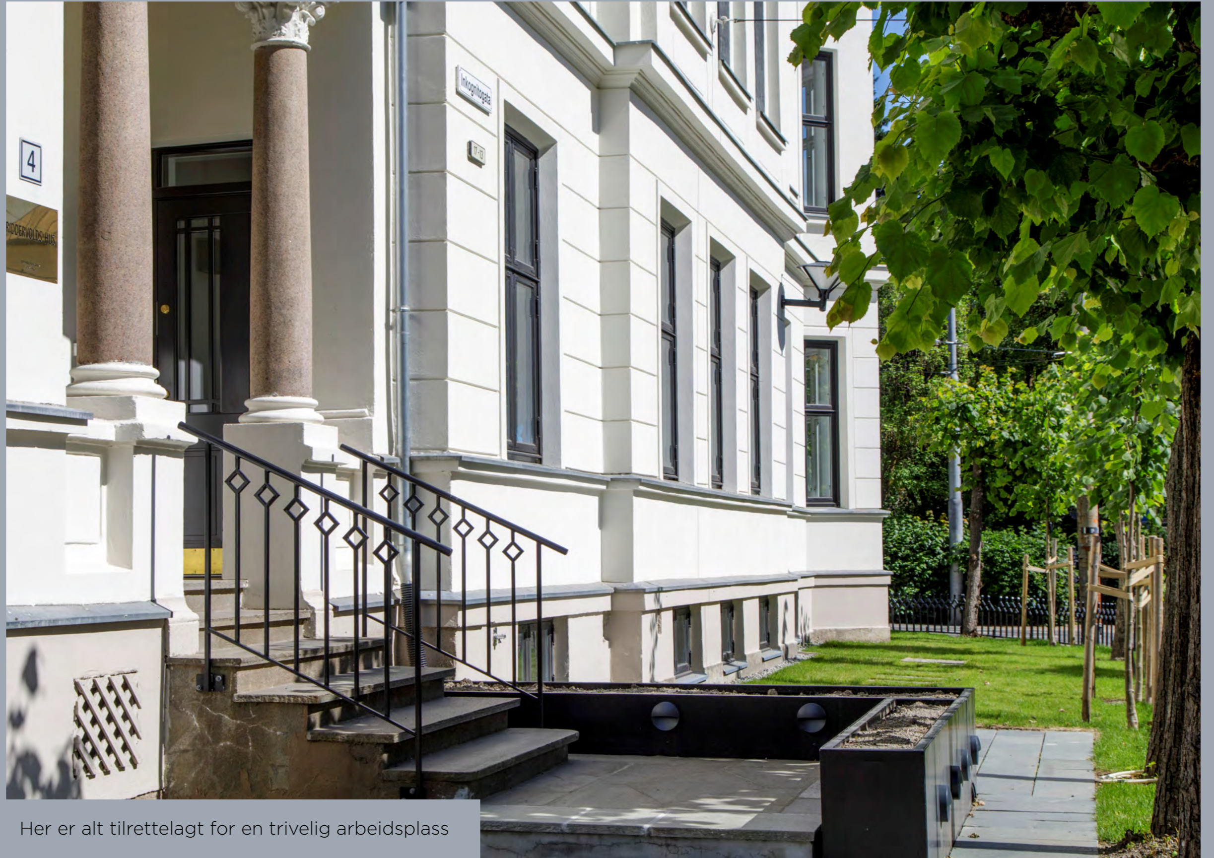
Her er alt tilrettelagt for en trivelig arbeidsplass