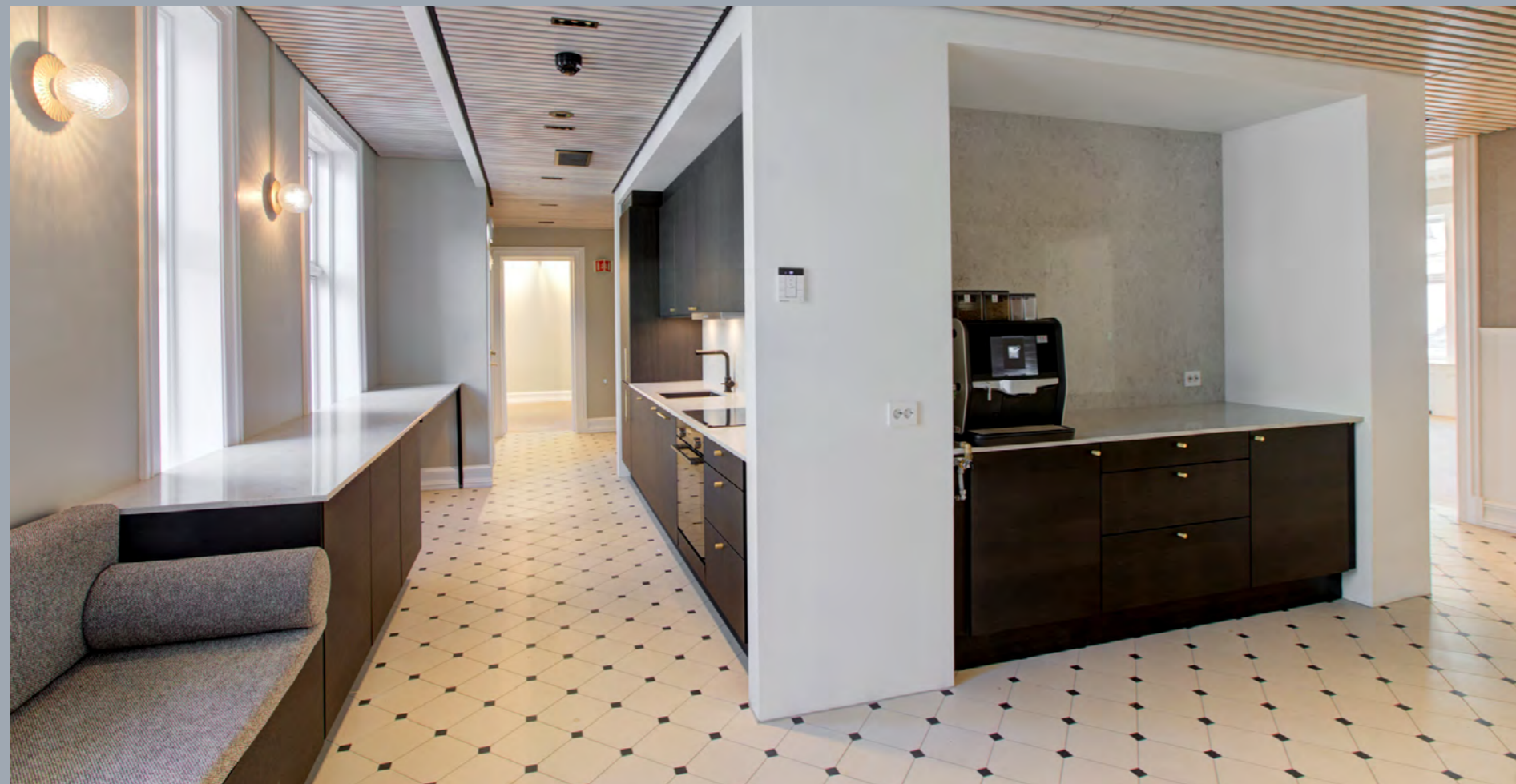
Sentralt plassert og moderne kjøkkenløsning