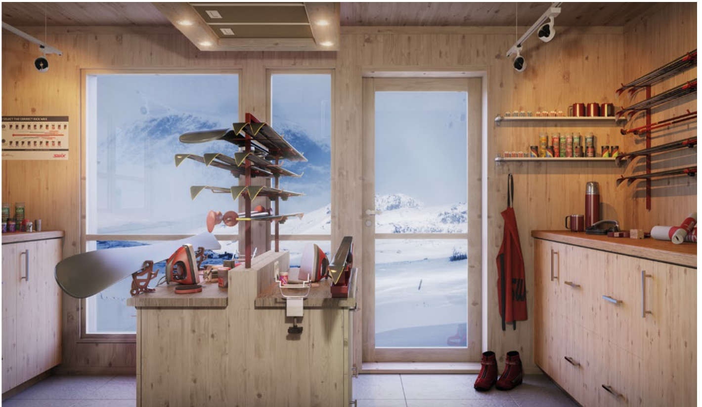
Ett av Blånes annekts, «Smørebod».