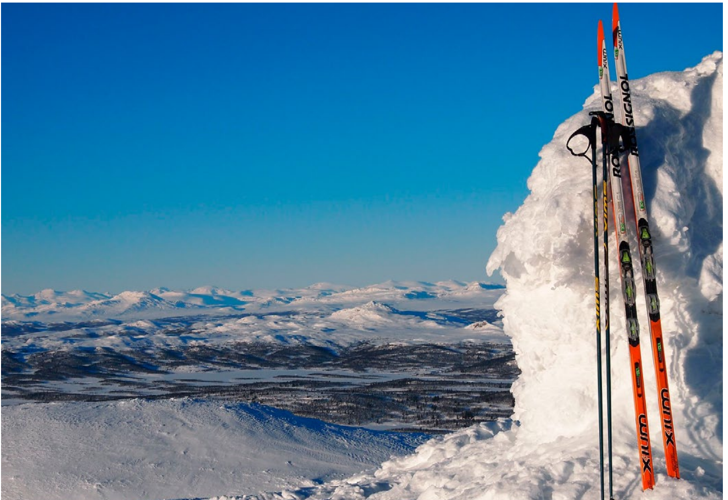
På toppen av Spåtind 1414 moh.