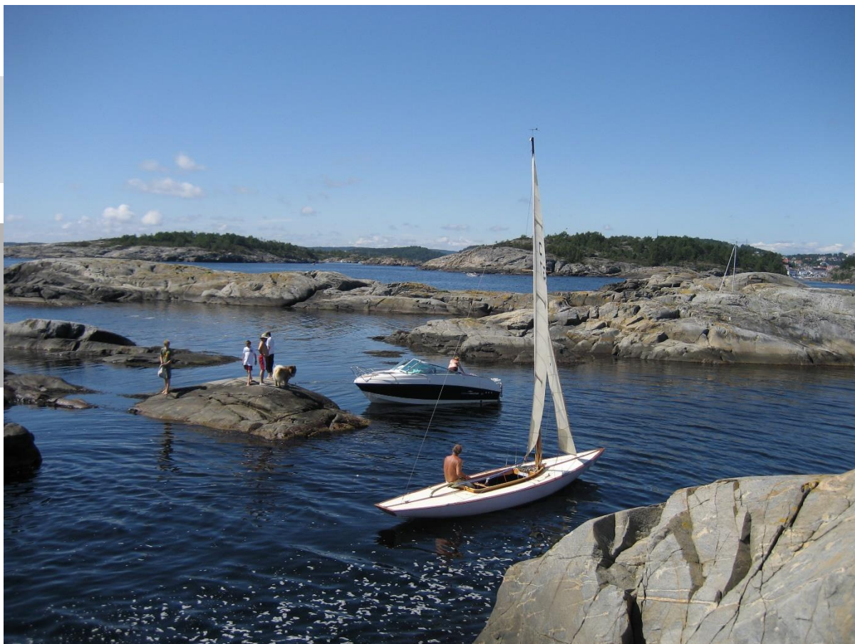
En av små øyer rett utenfor Risør by, der badelivet kan nytes.