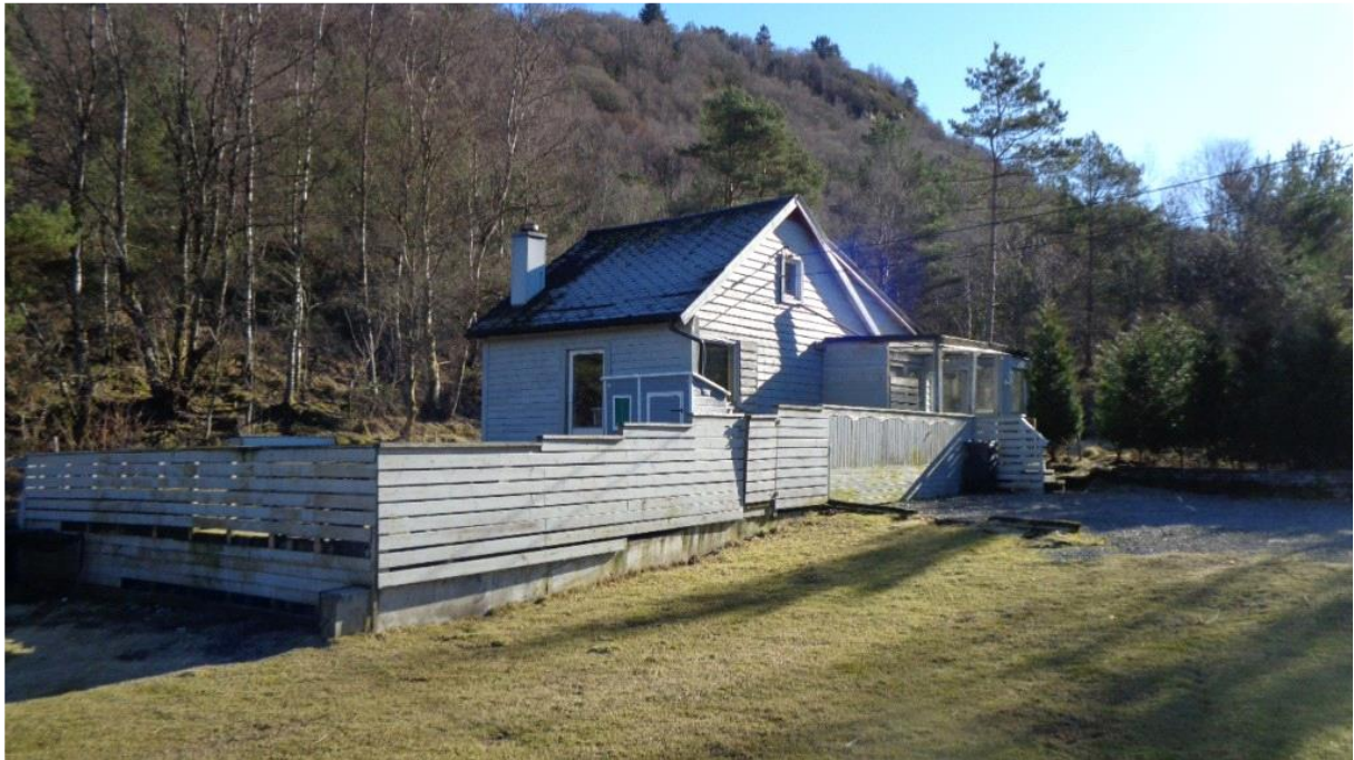
Fasade med terrasseplattning