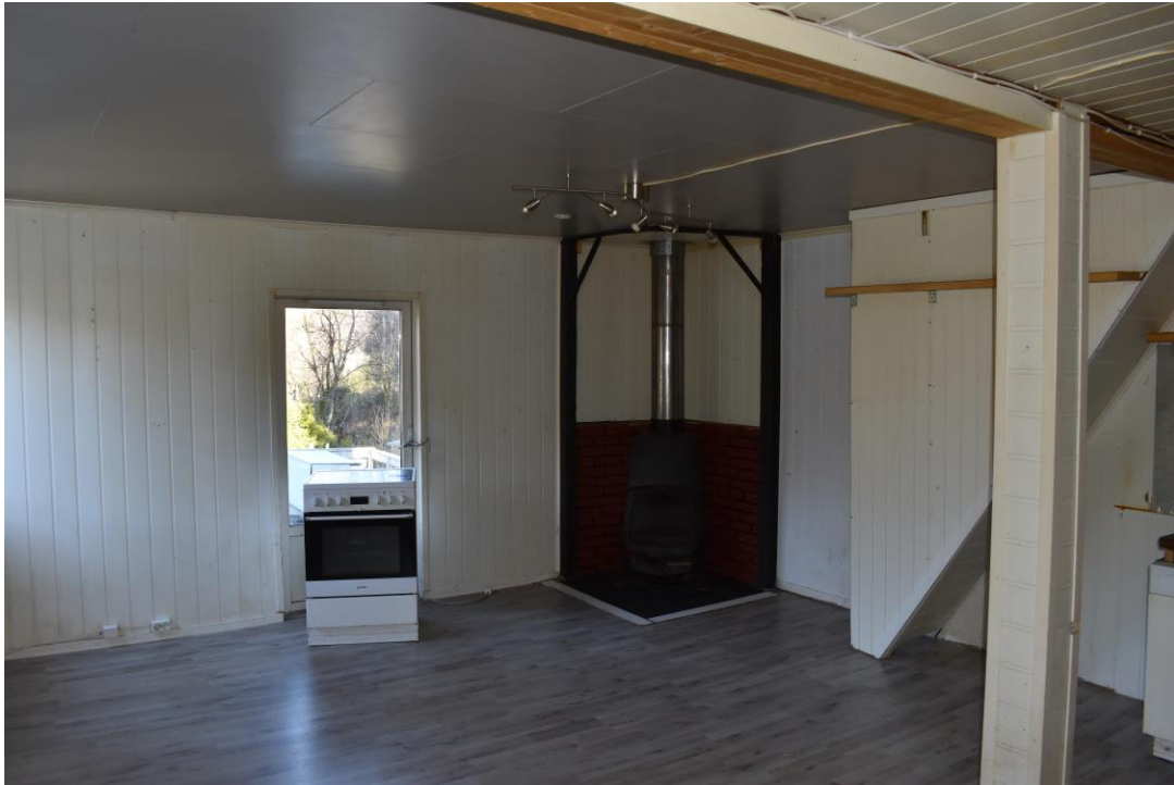
Stue / kjøkken