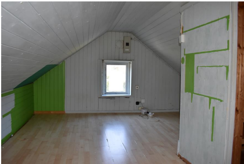
Loff – ikke målbart areal