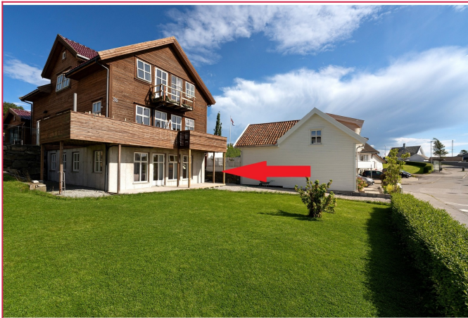
Fasade / Inngang