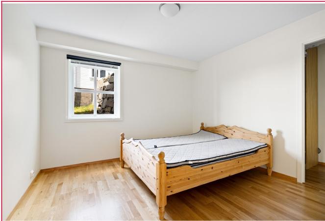
Hovedsoverom m. lagring