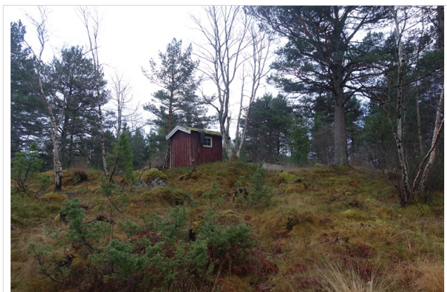
Fra veien og opp mot tomta

På denne bakgrunn anslås markedsverdien å ligge på ca. 120-130 % av den totale tomtekostnaden for eiendommen.