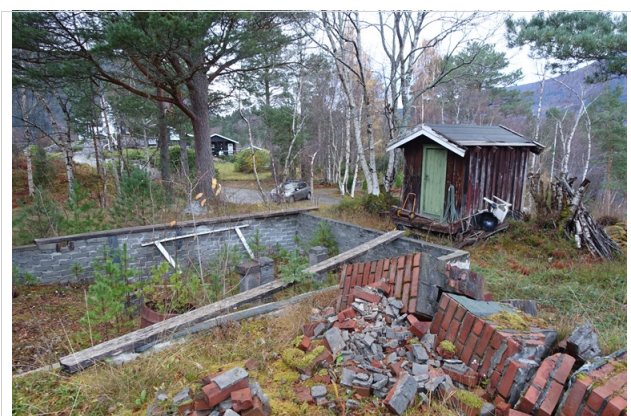
Gamle ringmurer og et eldre uthus

Det er kun rester av de gamle ringmurene som står ca. midt på tomteområdet, samt et lite uthus på ca. 5 m 2 . Det er lagt fram vann bort til uthuset, og ellers vil el. tilknytning kunne etableres fra eksisterende nett i området. Vedr. avløpsordninger så har de fleste hyttene i området egne lukkede avløpsanlegg i form av en septiktank, som knyttes opp mot den kommunale tømmeordningen. Alle tekniske tilknytninger må avklares med kommunen på vanlig måte.