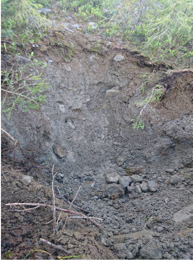
Sjaktning 2 – Nord-øst ved tomt nr. 14