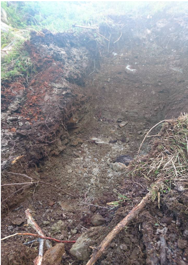
Sjaktning nr. 1 – Øst ved tomt nr. 5