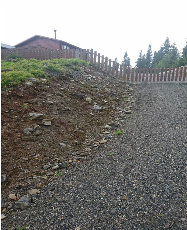
Skjæring – sør.