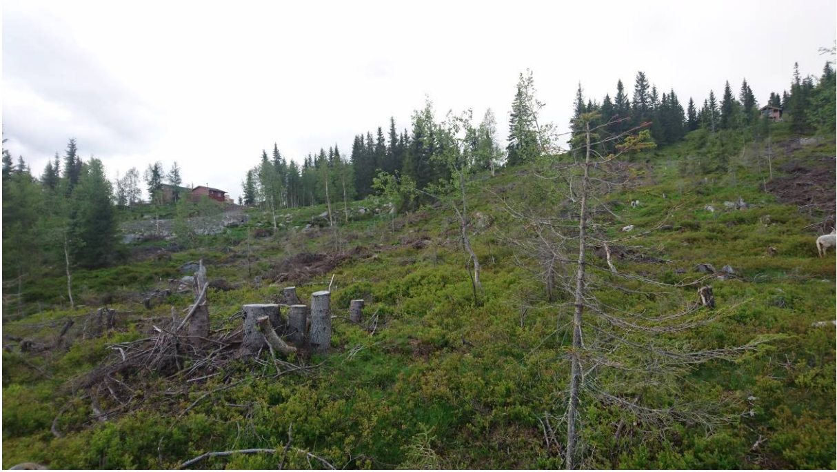
Oversiktsbilde 2, fra nord mot sør.