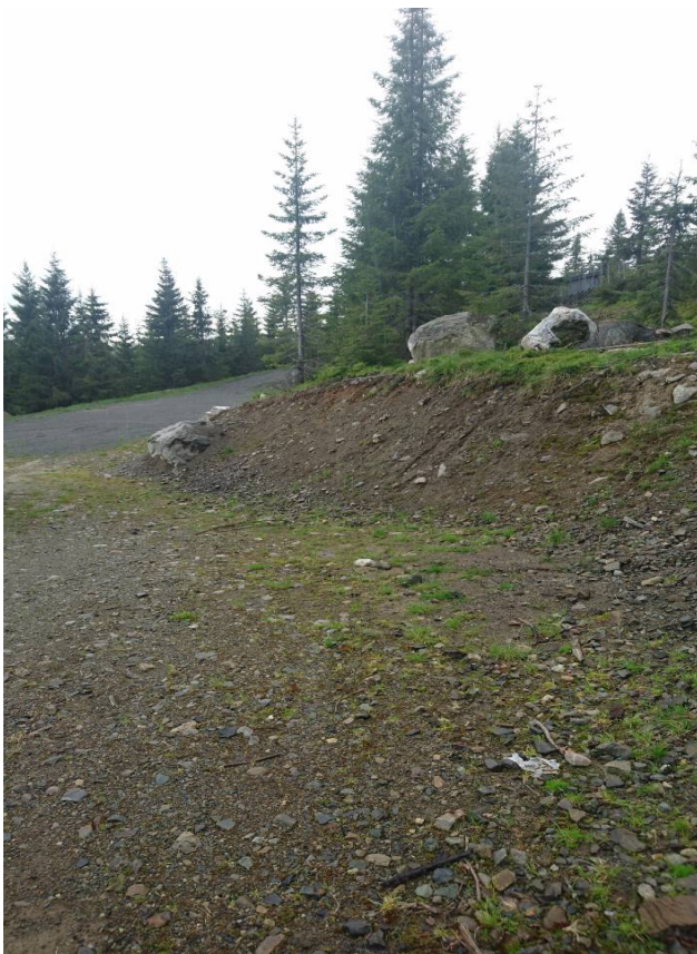
Skjæring i området – Vest.