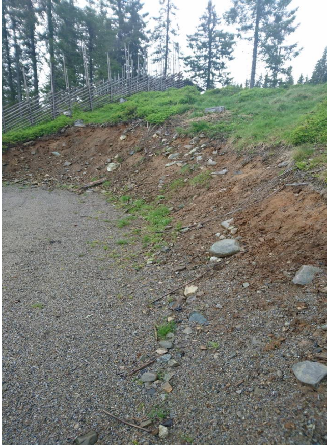
Skjæring – midt i området.