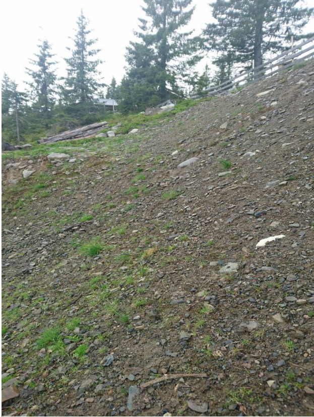
Skjæring i området – Vest.