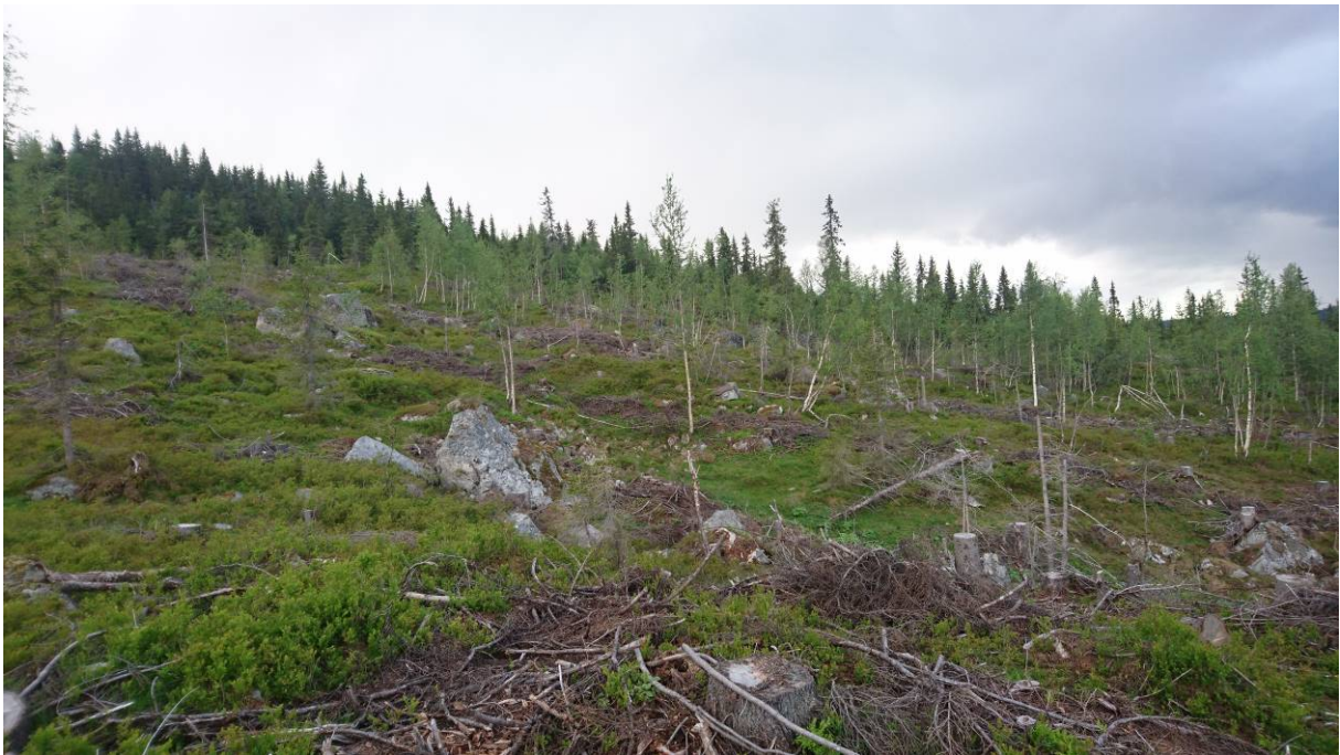
Oversiktsbilde 1, fra øst mot vest.

Det er foretatt sjakting på 2 steder og registrert skjøringer i eksisterende hytteområde. Dybden på prøvegroper varierer fra 1,4 – 2,0m.