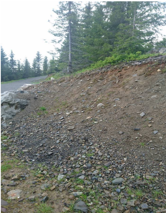
Skjæring i området – Vest.