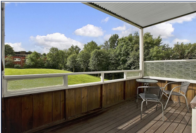
Romslig balkong med gode solforhold