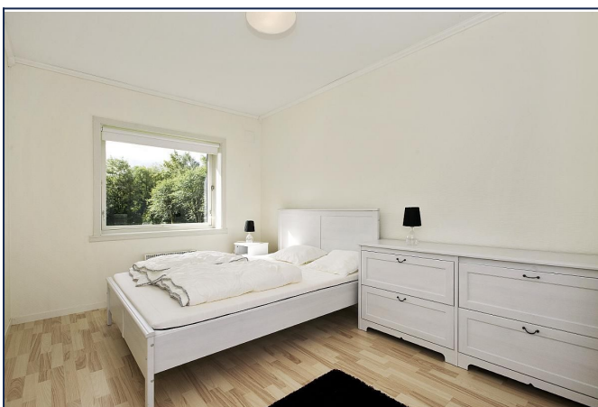
Soverom av god størrelse - Møblert med dobbeltseng og komode