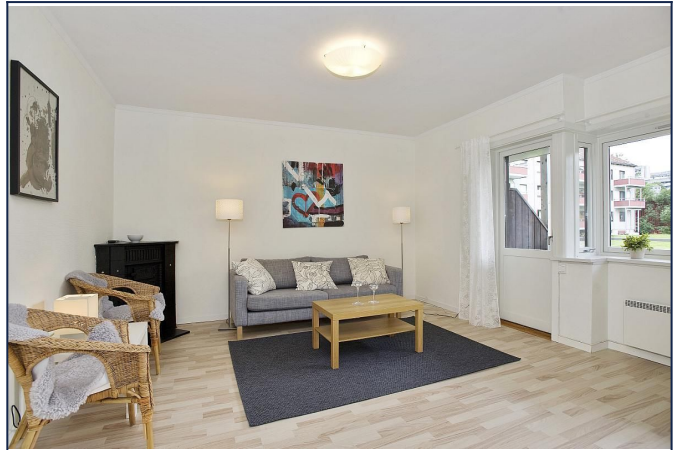
Fra stuen er det utgang til balkong