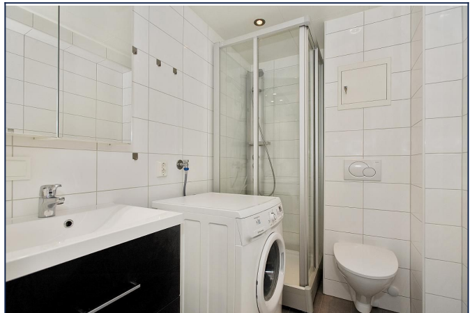
Helfisest bad med varme i gulvet - Vaskemaskin