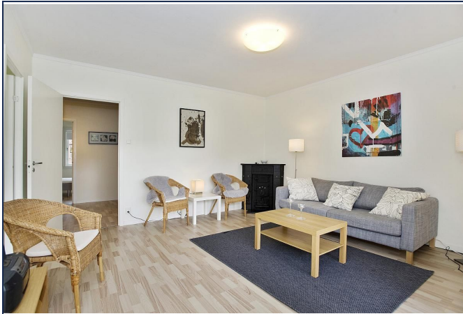
Lys stue møblert med sofagruppe - Vedovn