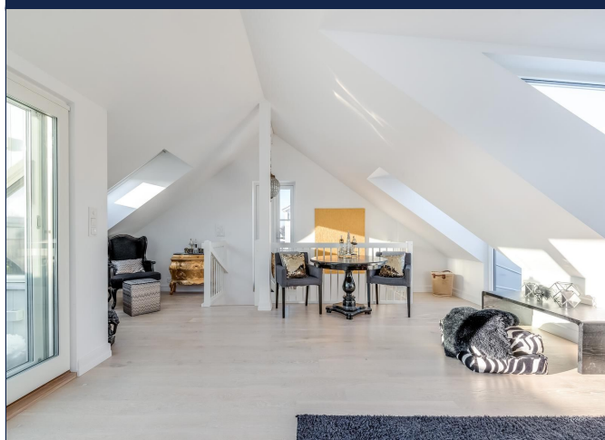
Sjarmerende stue i toppetasje.