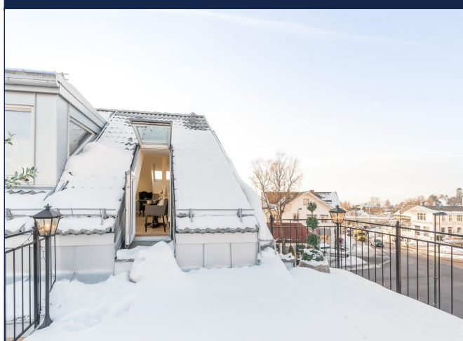
Takterasse med flott utsikt