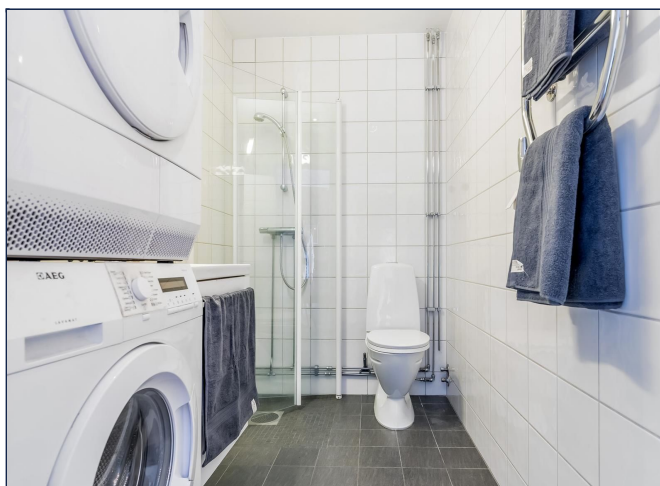
Bad med hvitevarer