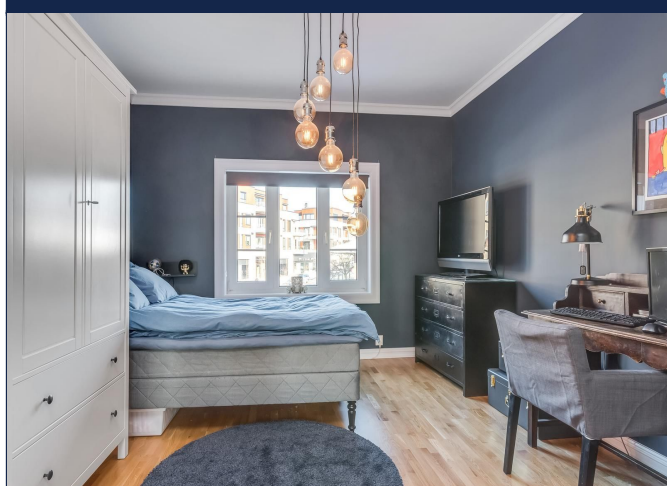
Hovedsoverom med garderobeskap