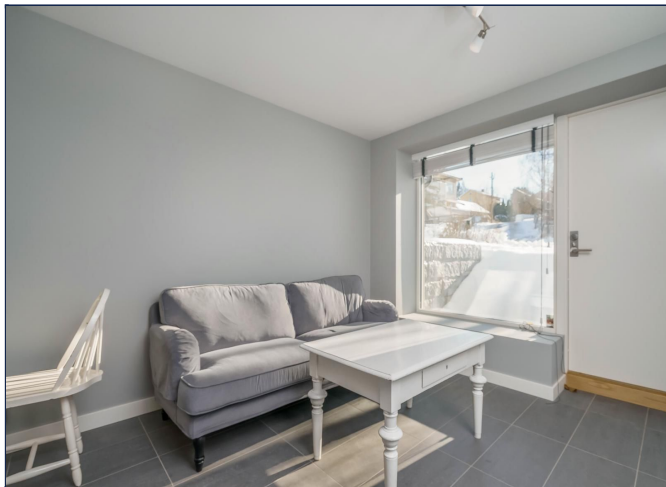
Stue med plass til sofagruppe

SAKSNUMMER 14367 - KRISTIAN AUBERTS VEI 38, HYBEL, 0760 OSLO