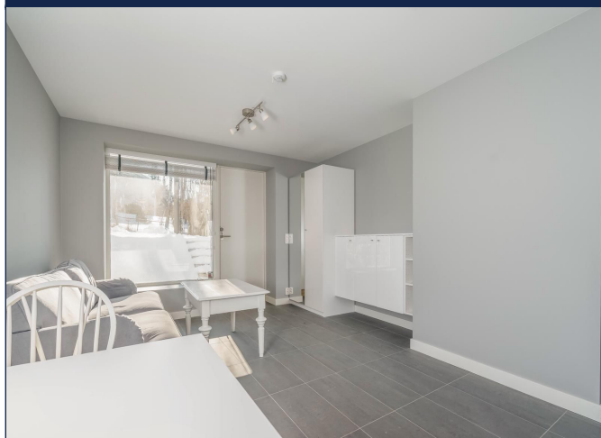
Stue med god oppbevaring- og skap plass