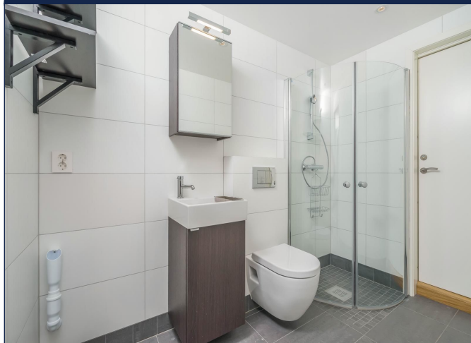
Moderne bad med varmekabler og opplegg til vaskemaskin