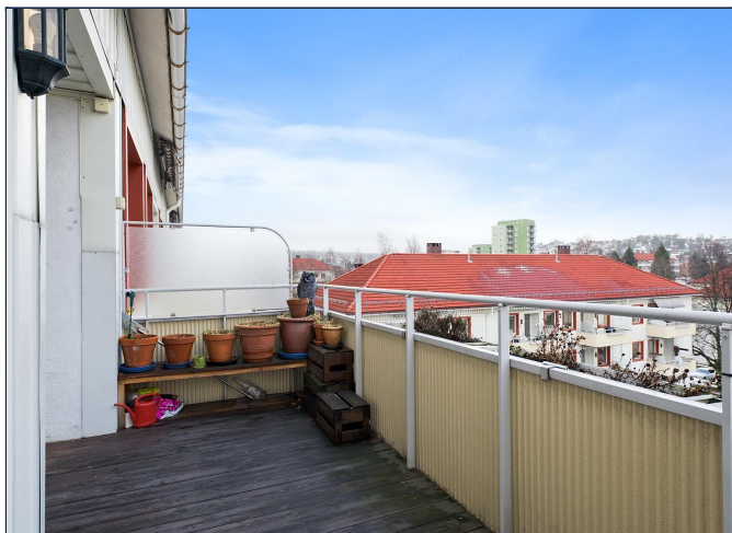
Stor og solrik balkong