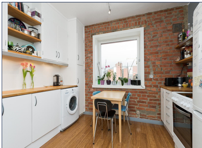
Kjøkken med hvitevarer