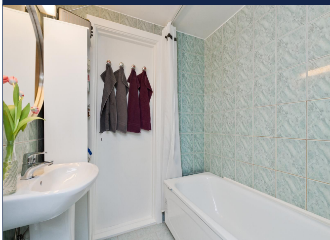
Bad med varmekabler