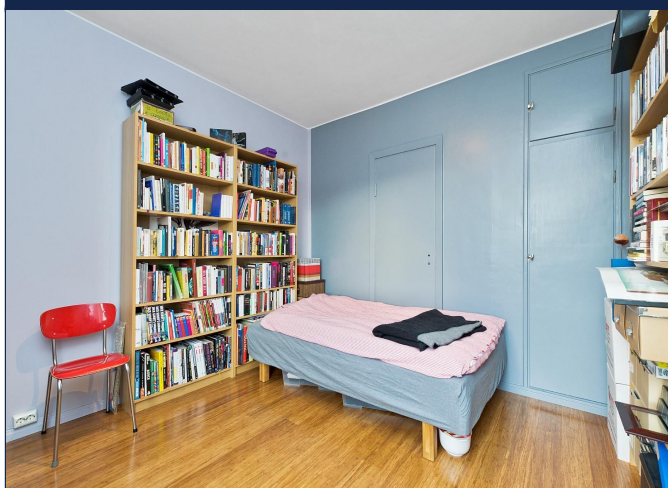
Soverom 1 ved stuen