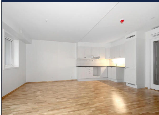
Stue mot kjøkken