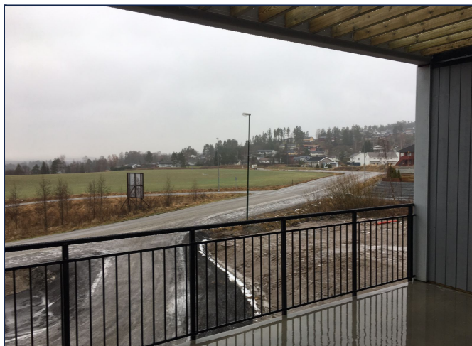
Utsikt ifra balkong på en grå vinterdag...