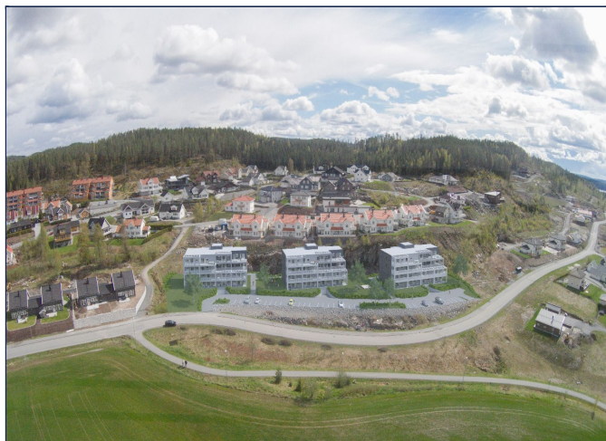
Skisse av området

SAKSNUMMER 14118 - SØNDRE EIDSVEI 1 C, 1940 BJØRKELANGEN