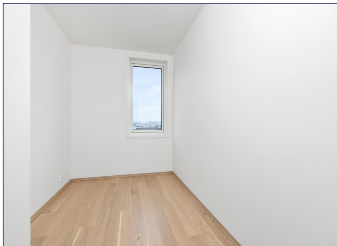
Soverom med skap