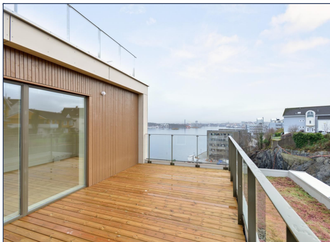
Terrasse med utsikt til sentrum