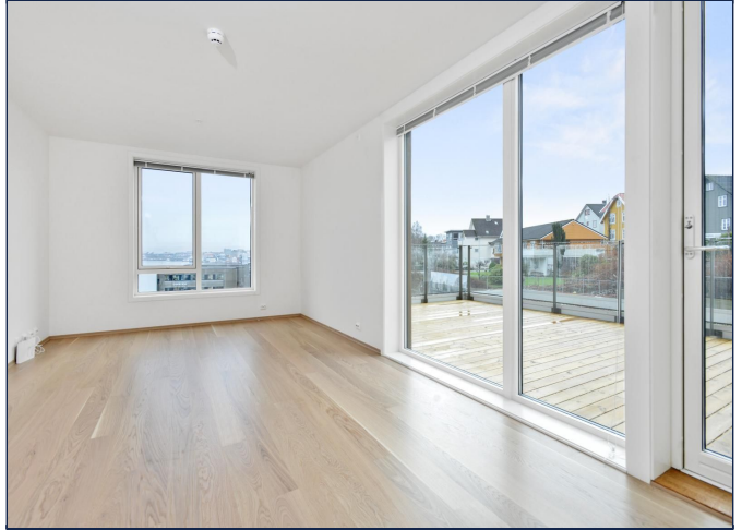
Stue med utsikt til Stavanger sentrum