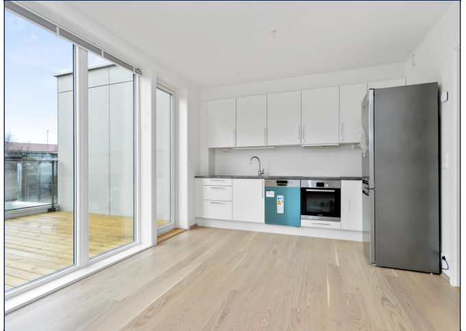
Kjøkken med utgang til stor terrasse