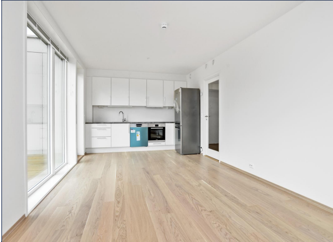
Kjøkken med spiseplass