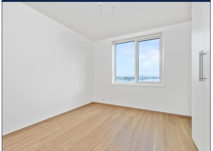
Hovedsoverom med skap