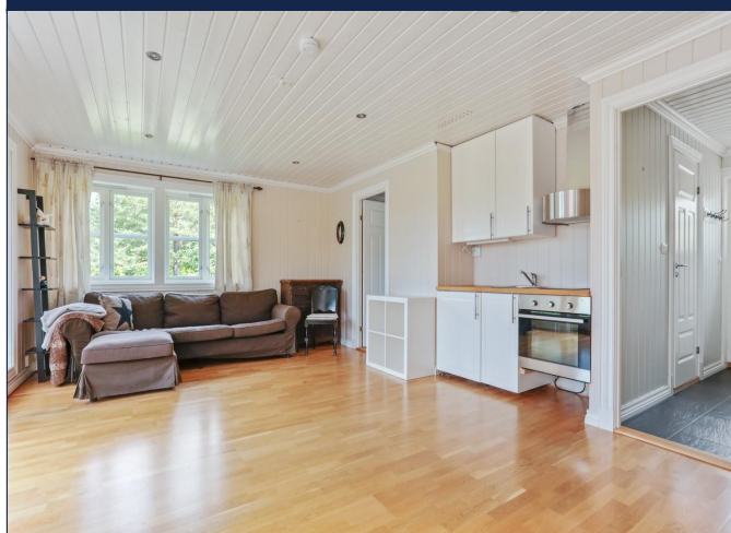
Stue / Kjøkken