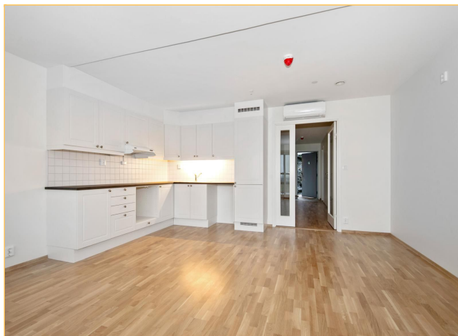
Stue mot kjøkken_bilde 2