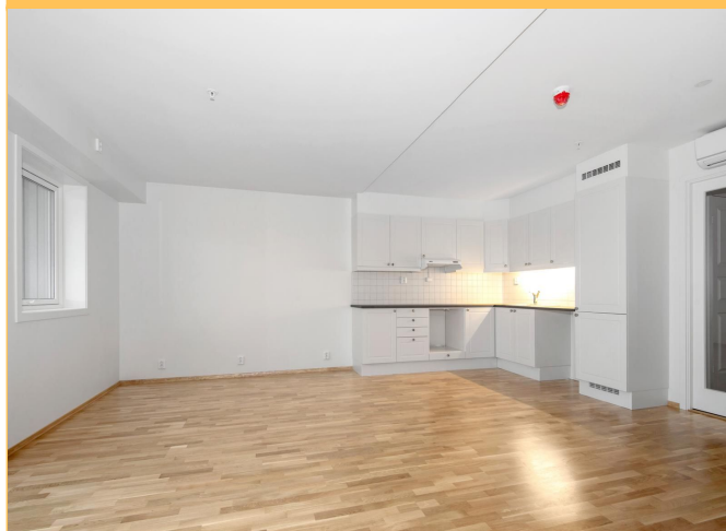
Stue mot kjøkken