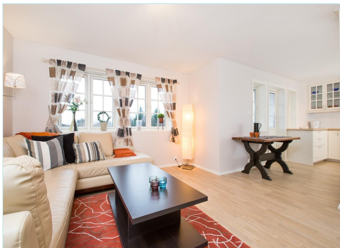
Stue mot kjøkken