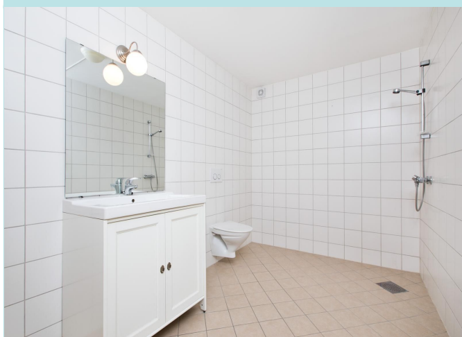
Delikat helfisest bad