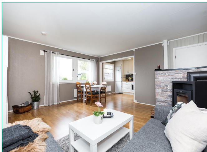
Stue/kjøkken i delvis åpen løsning