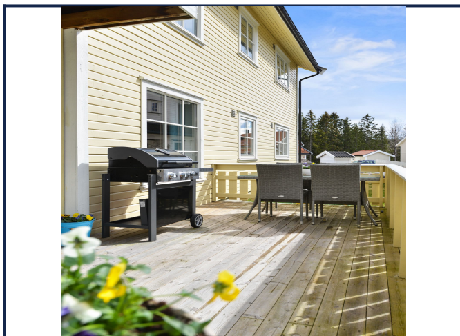
Terrasse - Gode solforhold