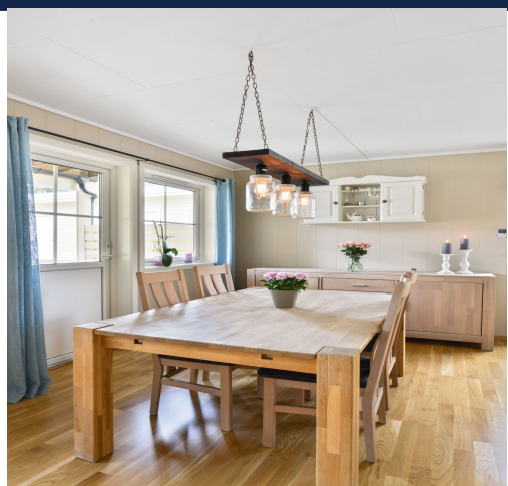
God plass til spisebord