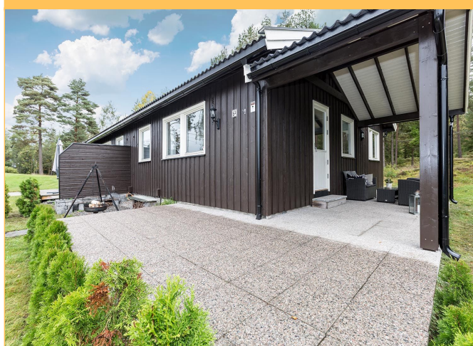
Terrasse (Kun 6A)