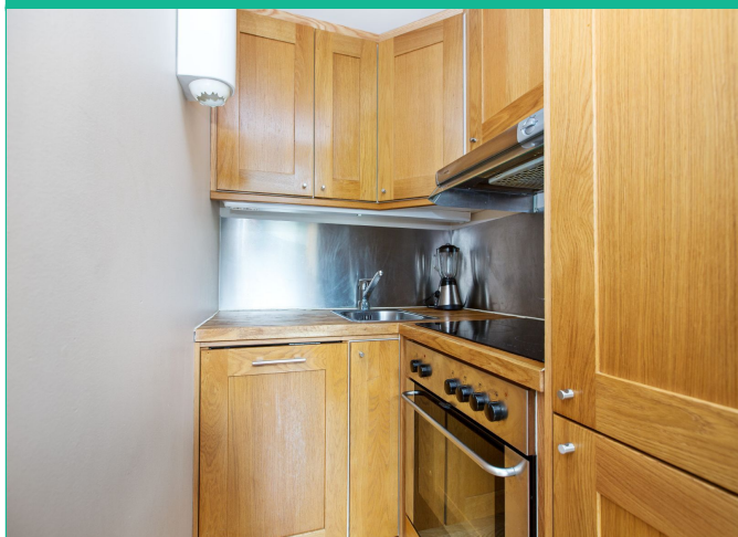
Kjøkkenet har alt av hvitevarer integrert.