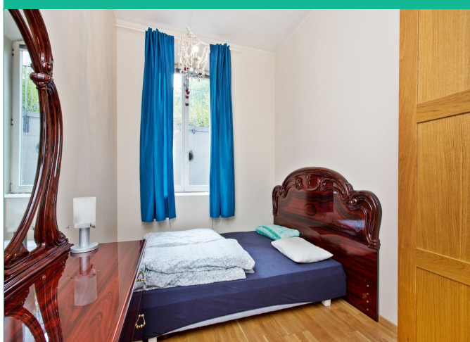
Soverommet ligger i 1.etg, og har god plass til garderobeløsning.