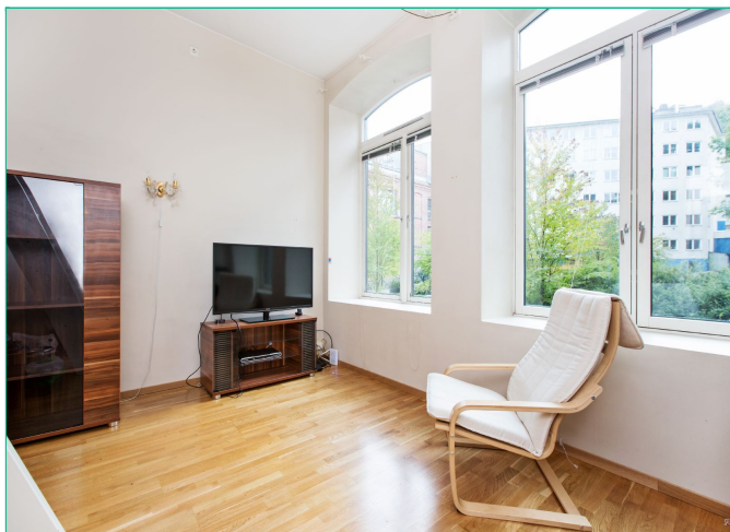
Stuen har svært god takhøyde, noe som gjør at boligen oppleves som luftig.

SAKSNUMMER 12380 - ALNAGATA 11, 0192 OSLO