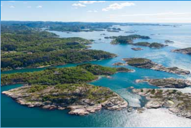
Det er et utall av øyer og holmer i skjærgården utenfor Lussevika. Her ligger alt til rette for holmeturer, fiske og bading.