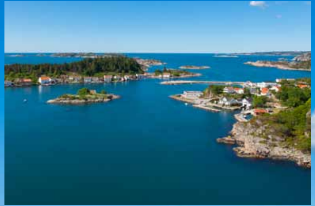
Den gamle uthavnen Svinør og bygda Åvik ligger rett ved Lussevika. Her lå seilskutene og ventet på god bær i gamle dager. Det var også mange losere som bodde her.