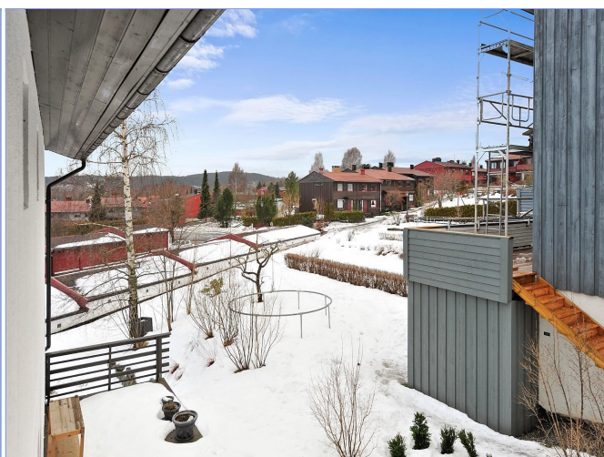
UTSIKT FRA FRANSK BALKONG