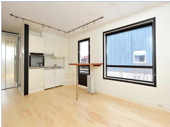
OPPHOLDSROM OG KJØKKEN