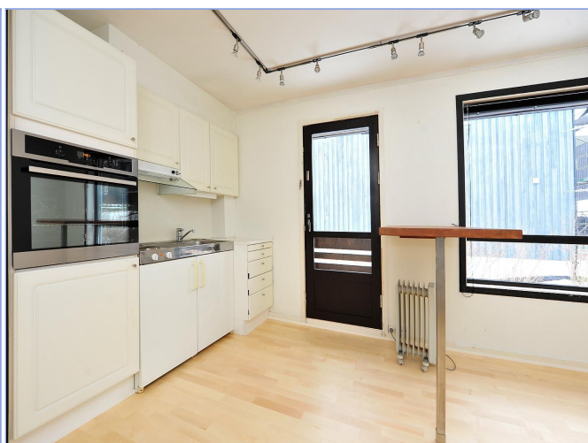
KJØKKEN MED FRANSK BALKONG