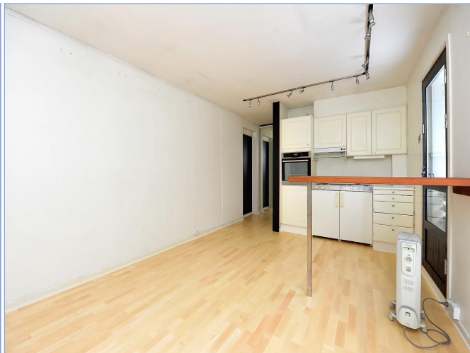
OPPHOLDSROM OG KJØKKEN