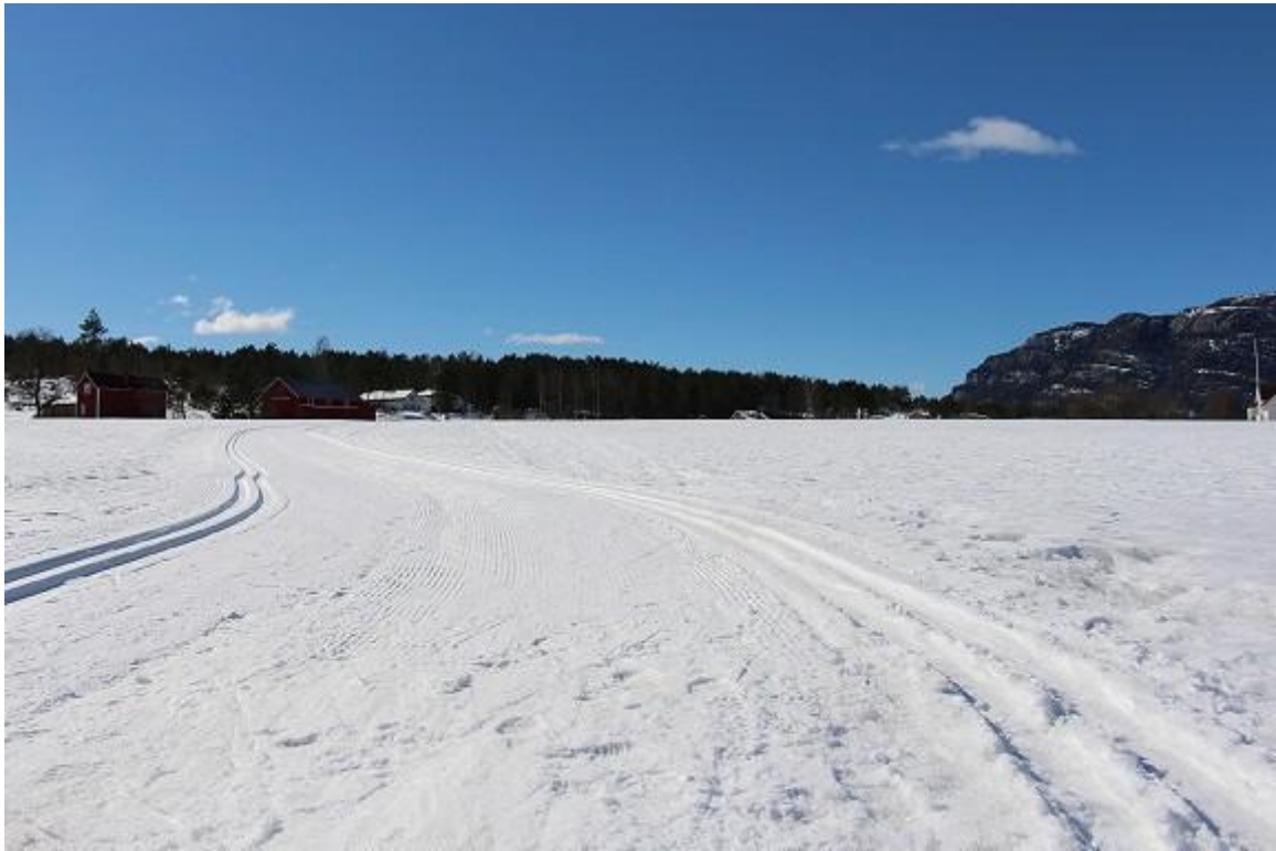
Bilde av ski terreng rett ved bolig