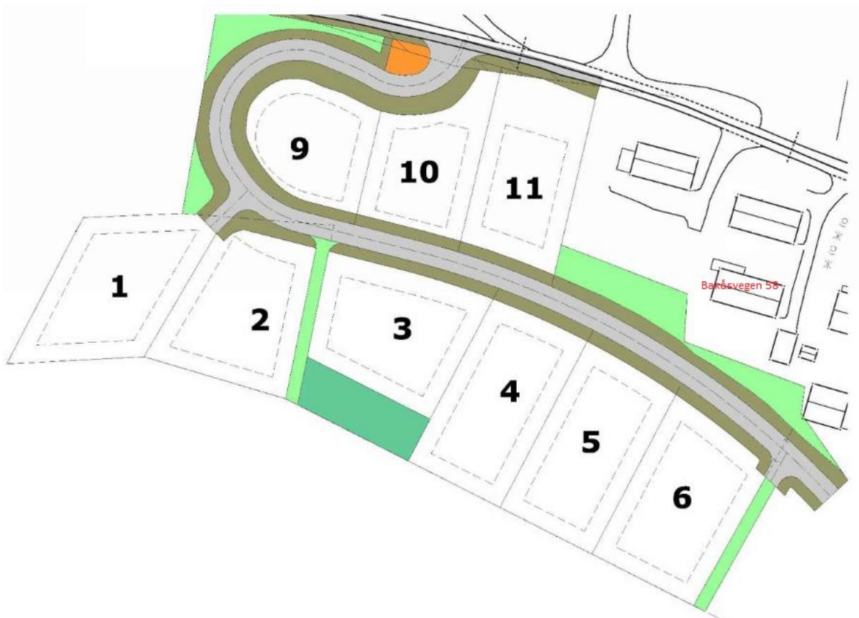
Viser nytt boligområde i forhold til Bakåsvegen 58